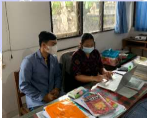
(Dokumentasi Penilaian Video Pembelajaran dari Responden 2)