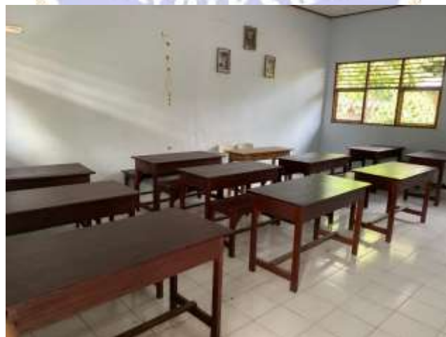
(Dokumentasi Ruang Kelas SD Negeri 1 Pulukan)