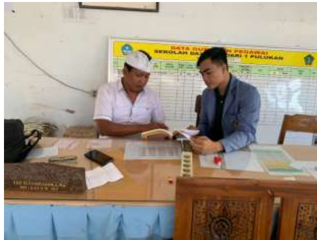
(Dokumentasi Saat Wawancara Dengan Guru SD Negeri 1 Pulukan)