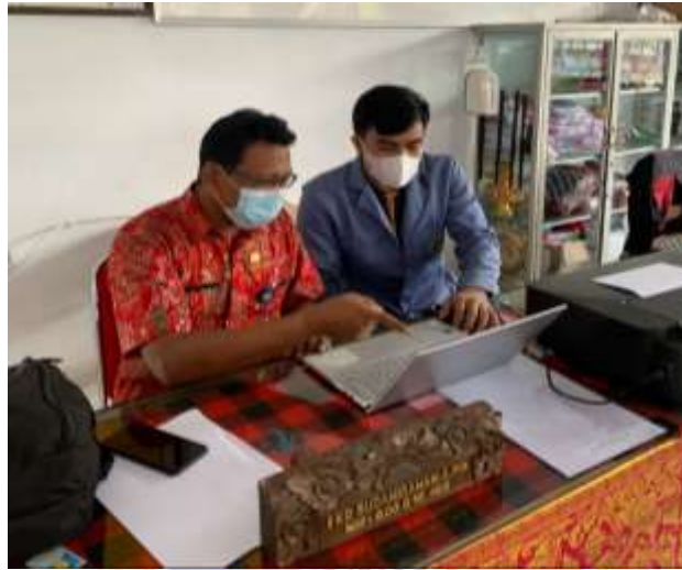
(Dokumentasi Penilaian Video Pembelajaran dari Responden 1)