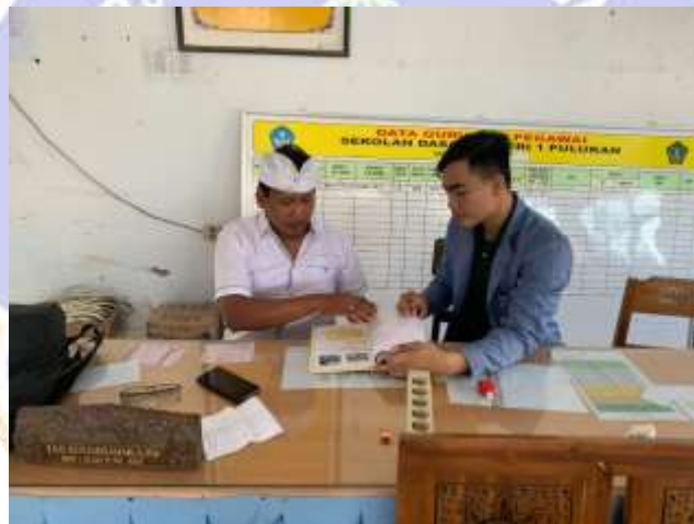
(Dokumentasi Saat Wawancara Dengan Guru SD Negeri 1 Pulukan)