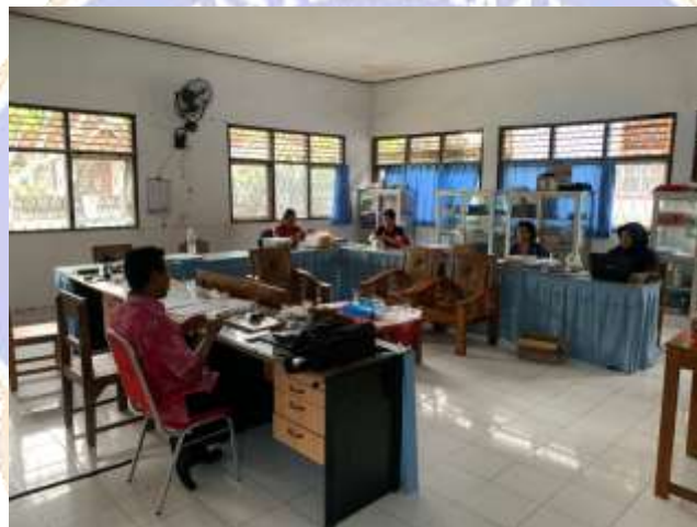
(Dokumentasi Ruang Guru SD Negeri 1 Pulukan)