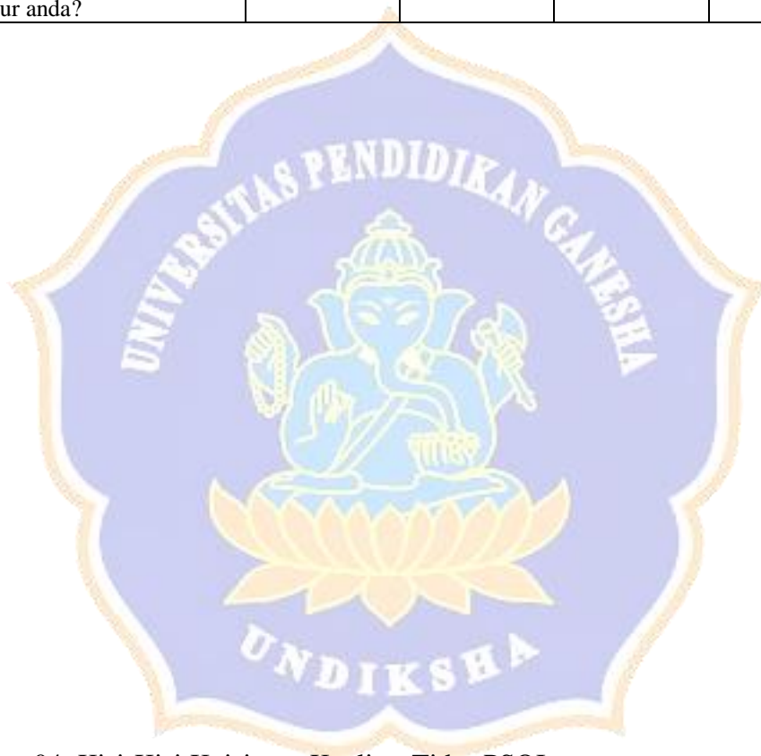
Lampiran 04. Kisi-Kisi Kuisisioner Kualitas Tidur PSQI