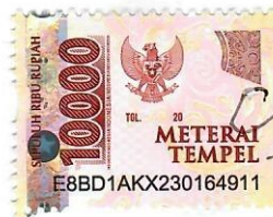
Tri Ayu Wahyuni

Singaraja, 27 Januari 2023 Yang memberi pernyataan,