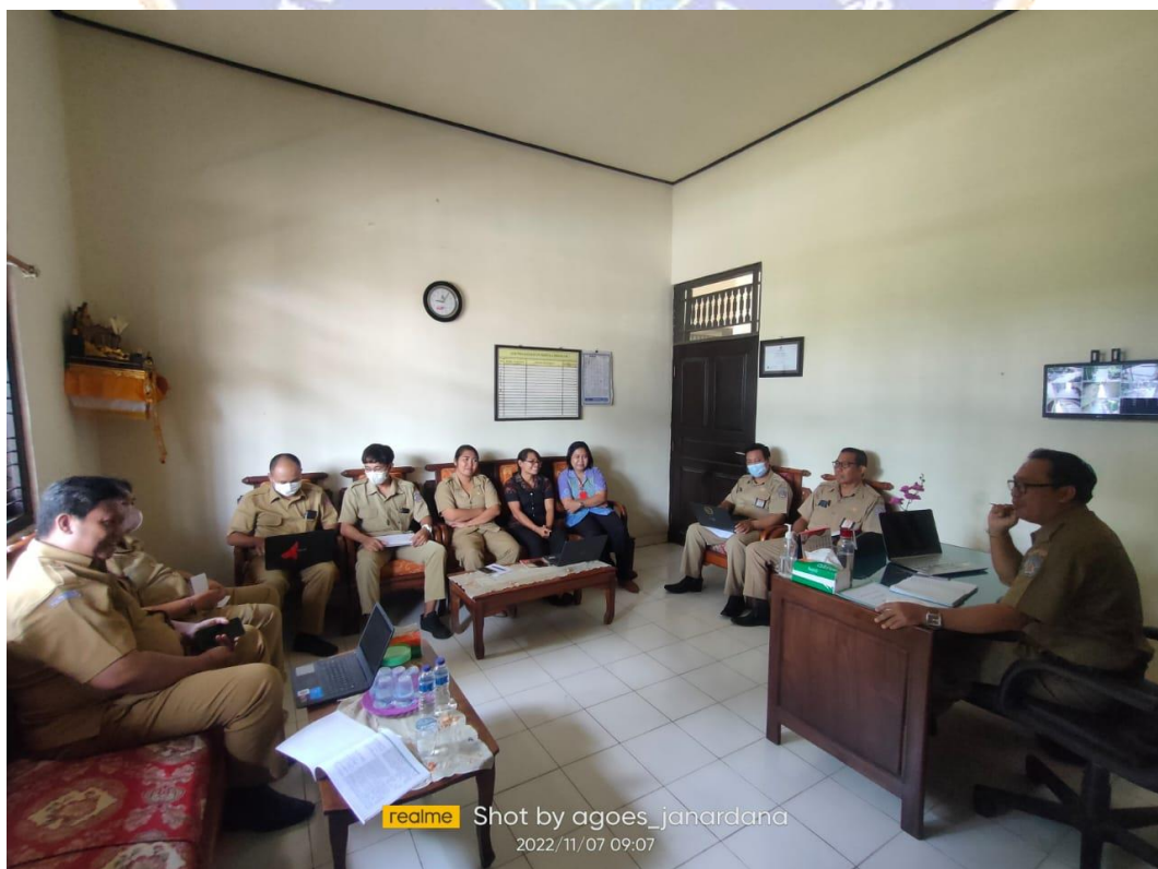
realme 2022/11/07 09:07