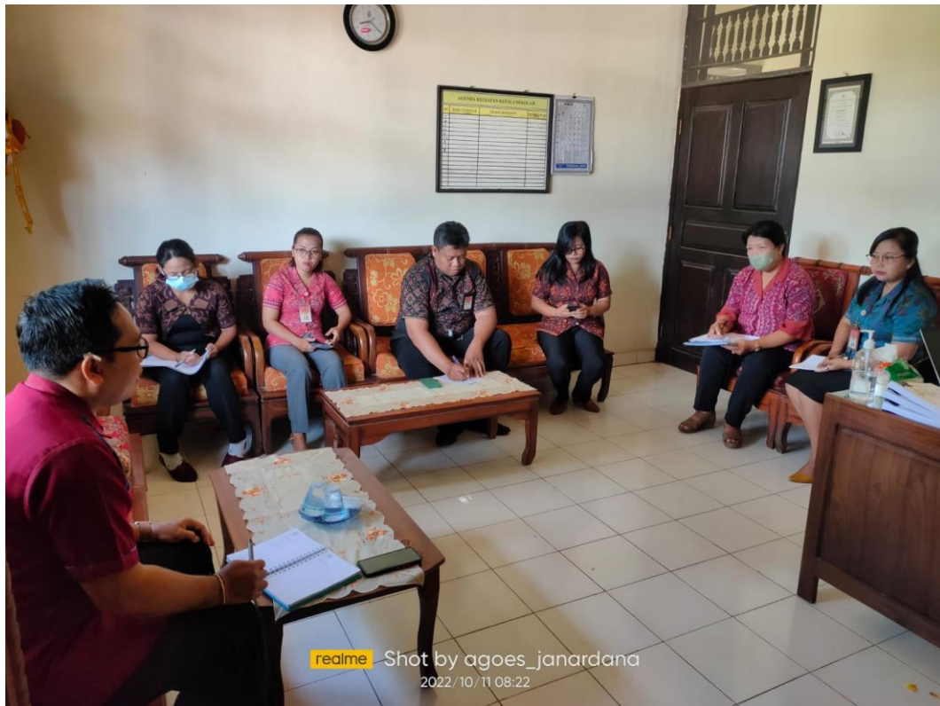
realme 2022/10/11 08:22