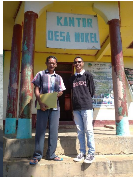
Pegawai Desa Mokel