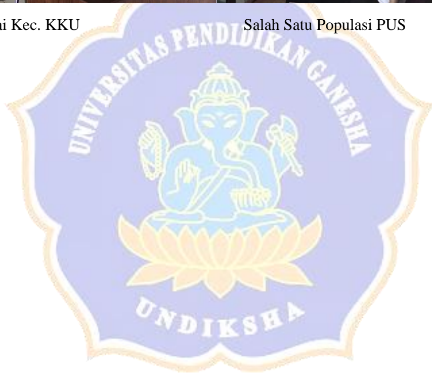
Salah Satu Populasi PUS