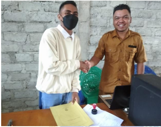
Kepala Desa Rana Mbeling