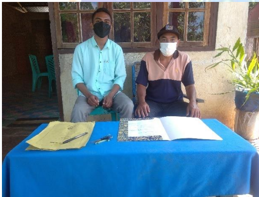
Kepala Desa Rana Mbata