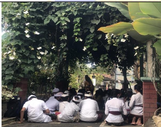
(Kegiatan Persembahyangan )