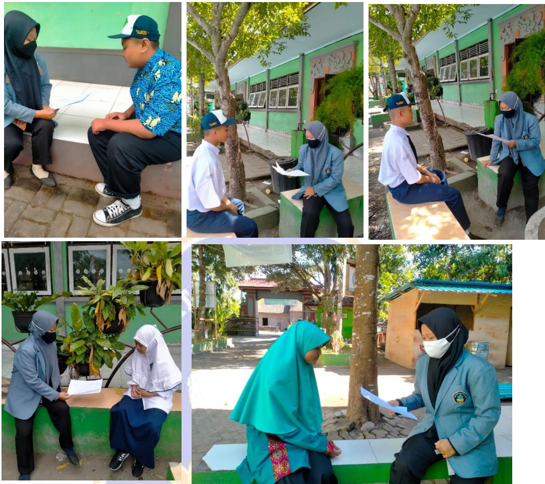
Gambar 2. Wawancara siswa