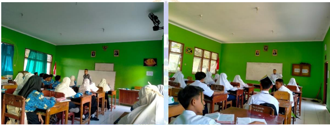
Gambar 5. Observasi Pembelajaran