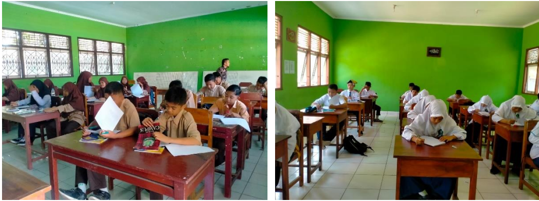
Gambar 4. Pengisian Angket siswa