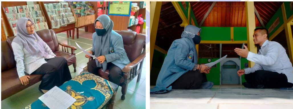
Gambar 3. Wawancara Guru