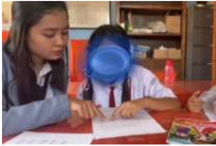
Observasi membaca siswa JD