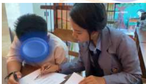
Observasi membaca siswa RD