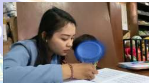
Observasi membaca siswa JP