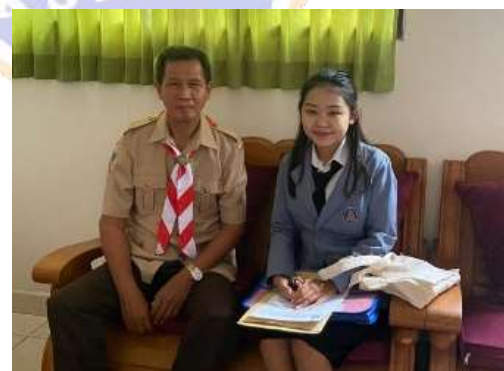
Pemberian surat keterangan telah melaksanakan pengumpulan data