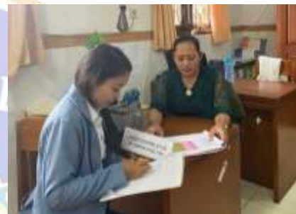
Observasi bersama guru di SD No. 5 Kerobokan Kelod