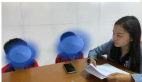
Wawancara Siswa RE dan RI