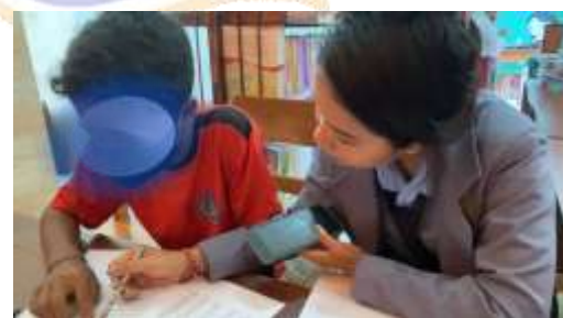
Observasi membaca siswa KBI