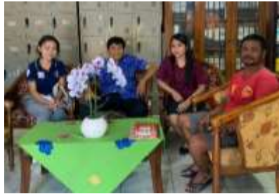
Observasi bersama guru di SD No. 1 Kerobokan Kelod