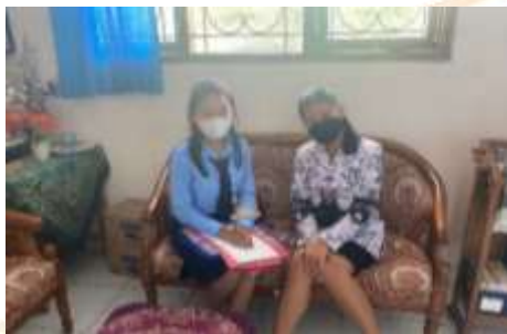
Observasi bersama guru di SD No. 4 Kerobokan Kelod