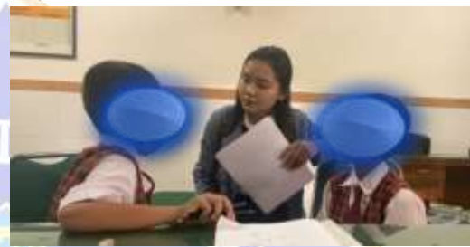
Wawancara Siswa EP dan AS