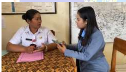
Wawancara bersama guru terkait dengan kesulitan membaca