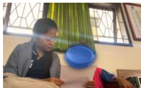
Observasi membaca siswa AS