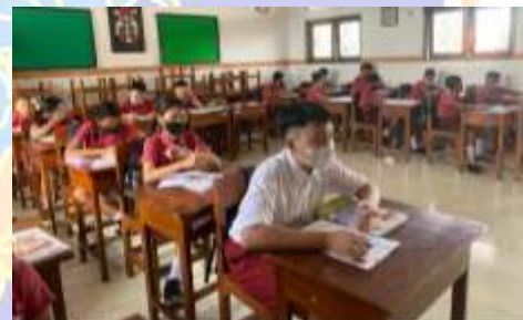
Observasi salah satu lingkungan kelas