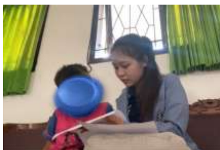
Observasi membaca siswa EP