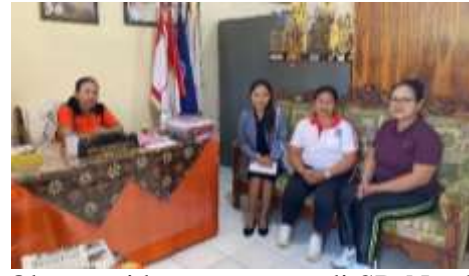
Observasi bersama guru di SD No. 3 Kerobokan Kelod