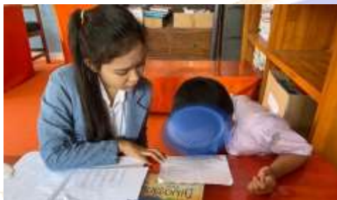
Observasi membaca siswa DA