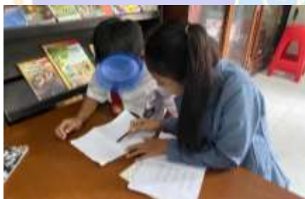
Observasi membaca siswa RE