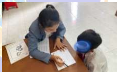
Observasi membaca siswa RI