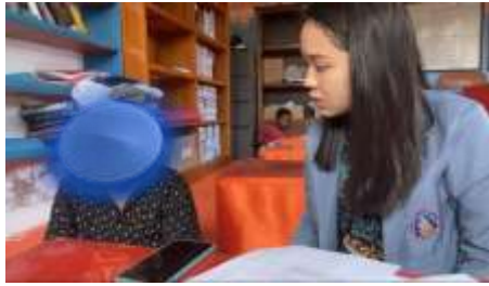
Wawancara Siswa DA