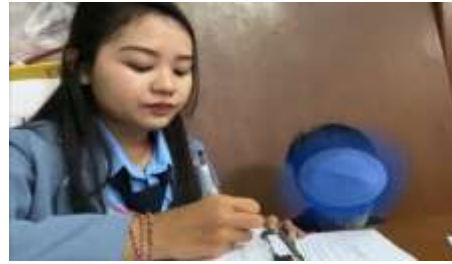
Wawancara Siswa JP