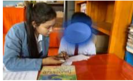
Observasi membaca siswa KBU