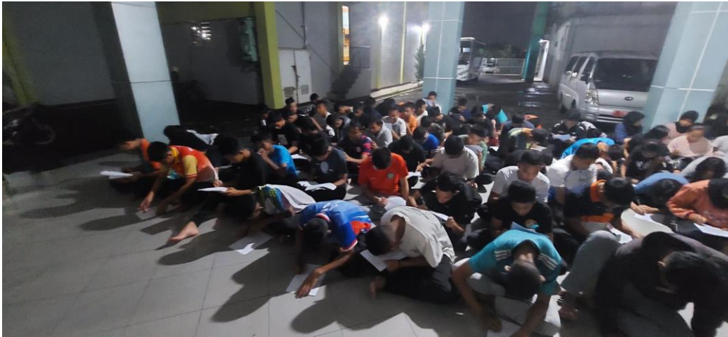
Lampiran 5. Setelah Pelaksanaan Pengambilan Data di PPOPM Kabupaten Bogor