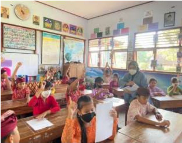
SD Negeri 3 Baler Bale Agung