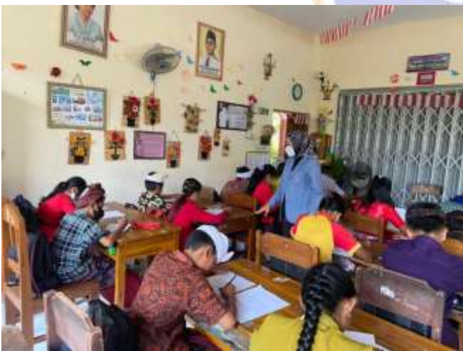
SD Negeri 2 Banjar Tengah