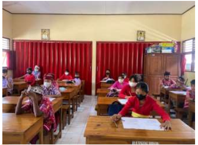
SD Negeri 4 Baler Bale Agung