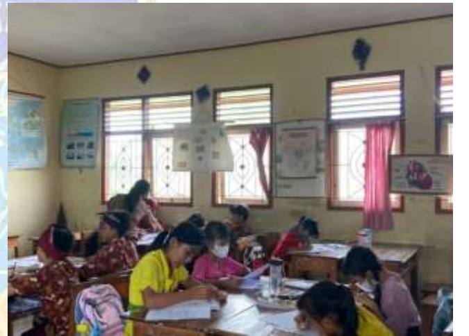
SD Negeri 1 Banjar Tengah