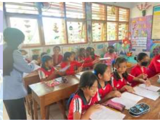
Pelaksanaan Menyebarkan Angket