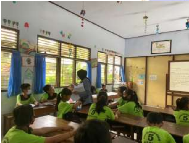
SD Negeri 5 Baler Bale Agung