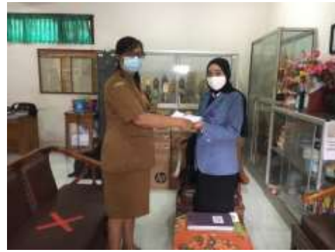
Pelaksanaan Uji Coba Instrumen