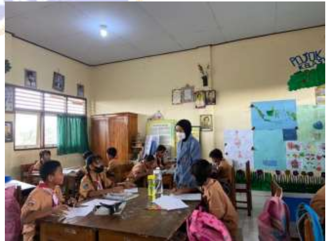
SD Negeri 3 Banjar Tengah