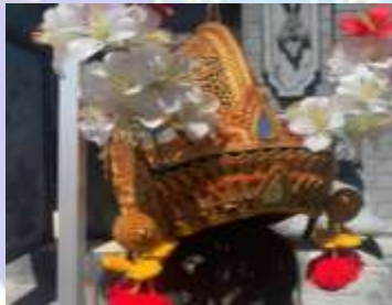
1) gelungan raja