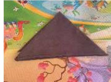
2) Udeng coklat