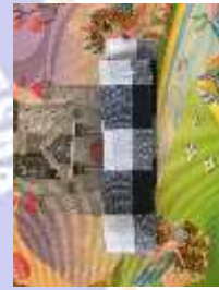
2) Slempad poleng