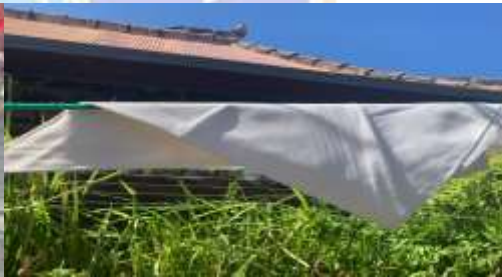
2) udeng putih