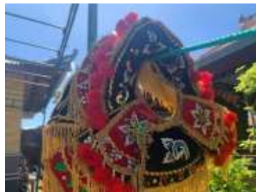
1) badong prebangsa