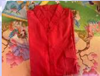
1) Kwace barak