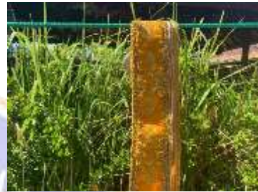
5) Sabuk prada kuning