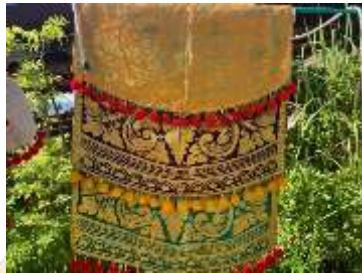
4) Angkep tunden