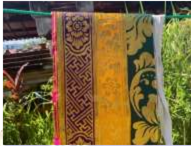
3) saput prada