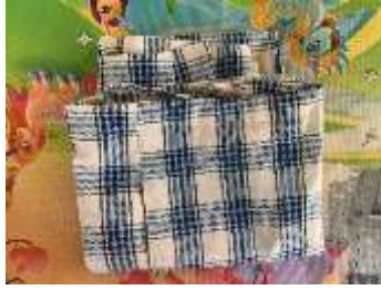
1) jaler poleng