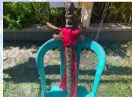
7) Keris prebangsa