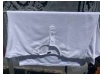
2) kwace putih lengan