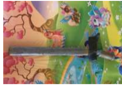
4) keris potet