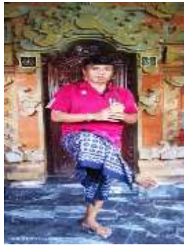
6) dedengkeng kanan