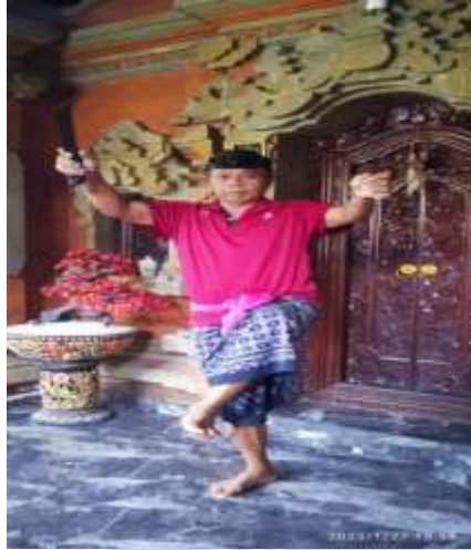
1) Gandang arep