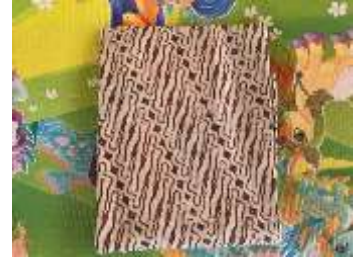
2) kamen batik