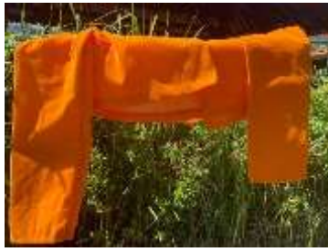
2) Kwace kuning lengan dawe