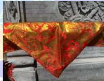
1) udeng prada barak