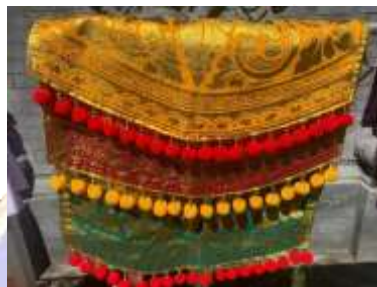
5) angkep tundun