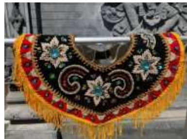
1) badong potet