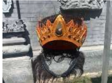
1) Gelungan baris