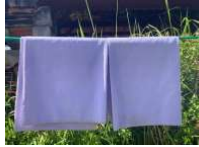
2) kamen putih