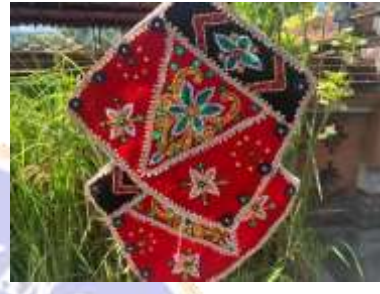
4) stewel kain