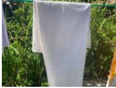
1) jaler dawe putih