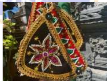
1) gelang kana kain