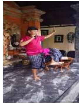
7) melingser kanan