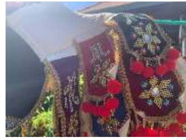
3) Angkep pala