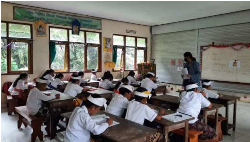
Lampiran 38. Dokumentasi Penelitian