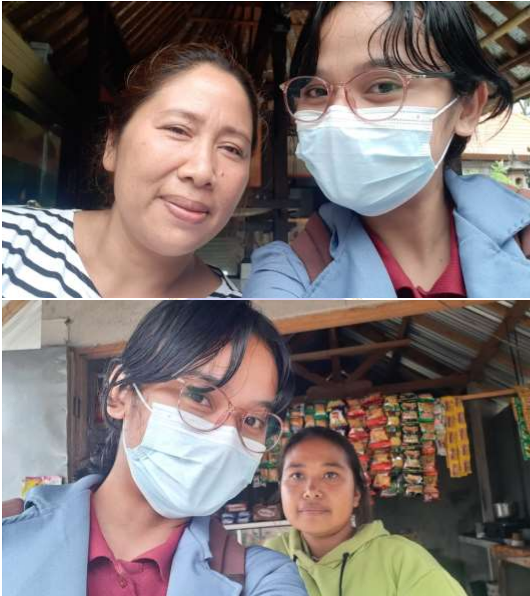
Dokumentasi kegiatan pelaksanaan penelitian bersama subjek siswa dan orang tua di Gugus III Kecamatan Susut.