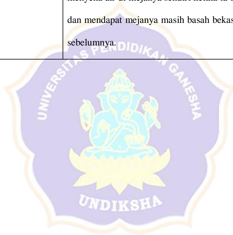
Lampiran 3 Kartu Data: Pola Kesantunan Berbahasa