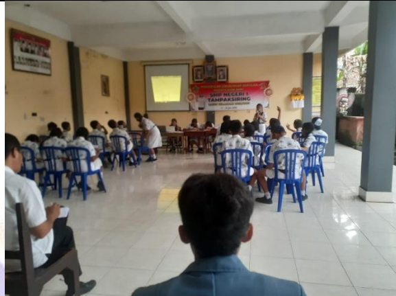
Pembelajaran di Aula