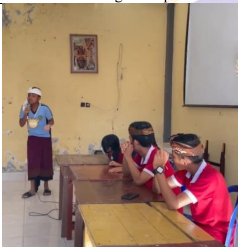
Perkenalan Pengurus Osis baru