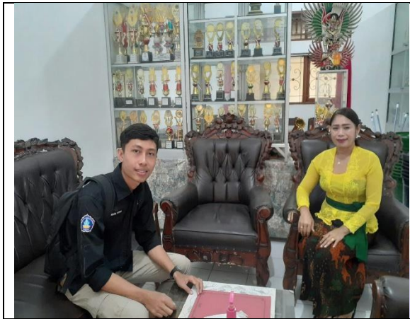
Penyerahan Surat Izin Melaksanakan Penelitian