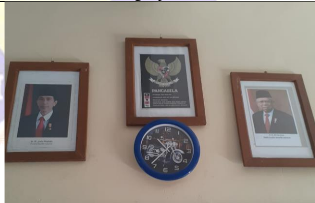
Memajang simbol-simbol negara