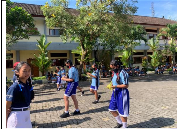
Lomba "Ngulat Tipat"