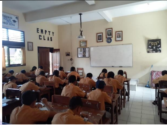
Pengisian Angket Cinta Tanah Air, Toleransi, dan Demokratis oleh Siswa