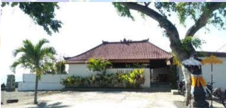
Restaurant/warung makan disekitaran Pantai Umeanyar