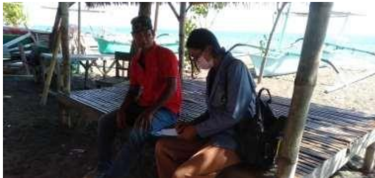
Wawancara dengan masyarakat pengelola pantai