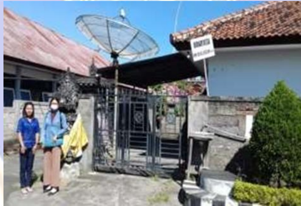
Bidan/polindes Desa Umeanyar