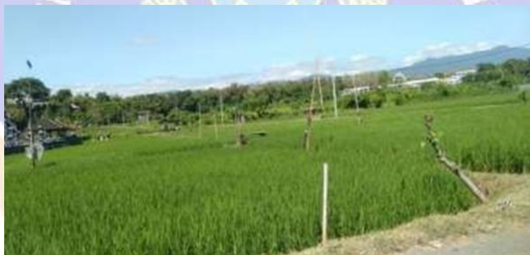
Hampan sawah yang ada disekitaran Pantai Umeanyar