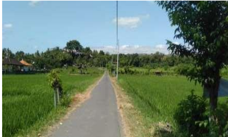
Kondisi jalan menuju Pantai Umeanyar