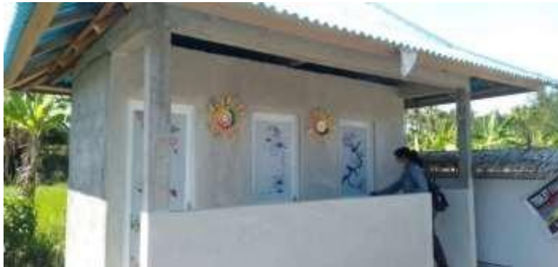
Kondisi toilet di Pantai Umeanyar