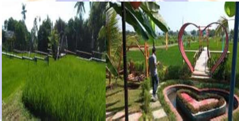
Stop foto dihampanan sawah sekitaran Pantai Umeanyar