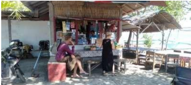
Warung atau pedagang kaki lima di Pantai Umeanyar