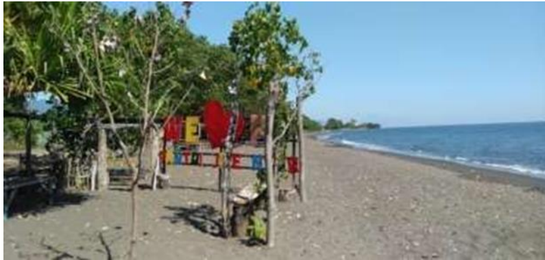
Stop Foto Dipesisir Pantai Umeanyar