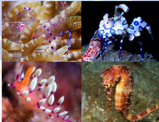
Biota laut di Pantai Umeanyar