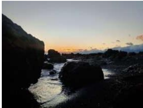
Penomena matahari tenggelam Pantai Umeanyar