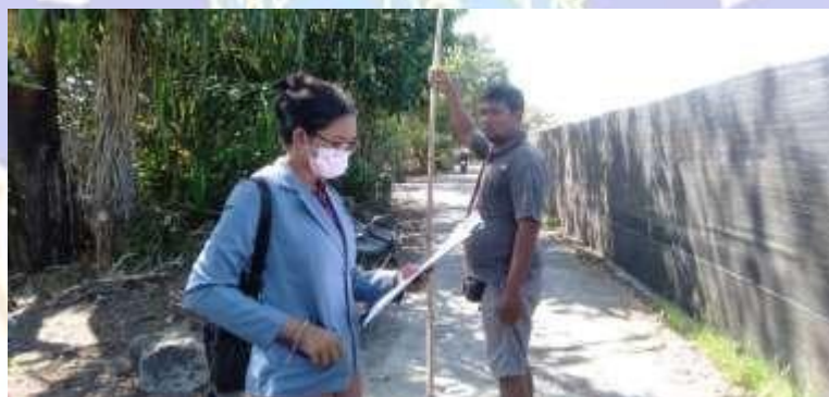
Wawancara dengan masyarakat pengelola pantai