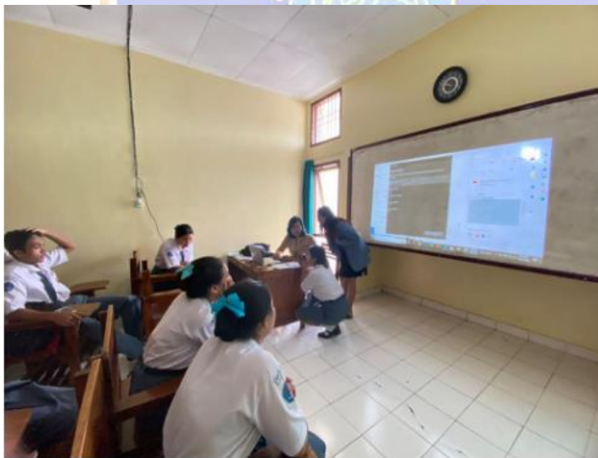
Figure 4 Documentation at XII Hospitality 3