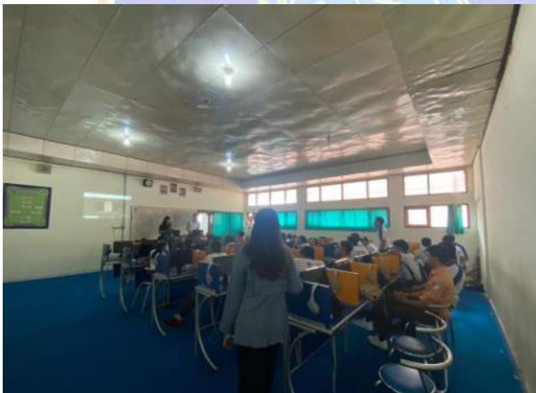
Figure 2 Documentation at XII Hospitality 2