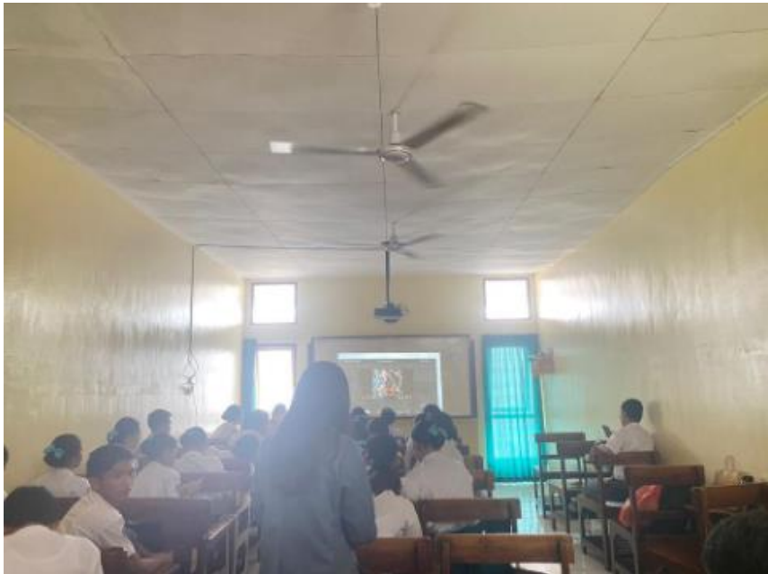
Figure 3 Documentation at XII Hospitality 3