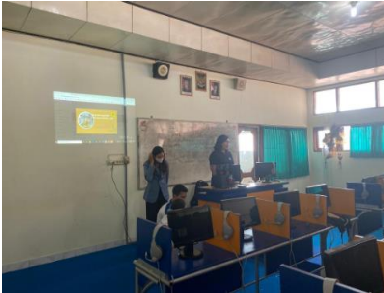
Figure 1 Documentation at XII Hospitality 2