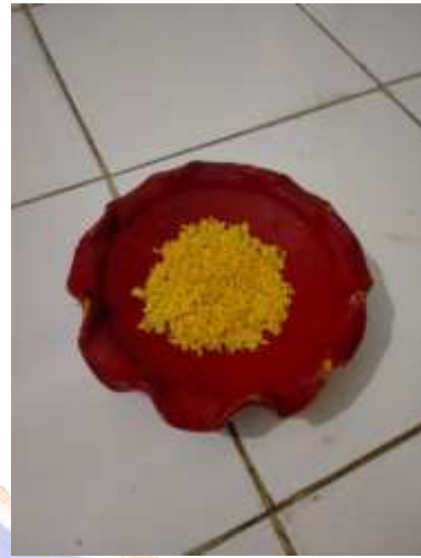
Figure17. boko bongi monca