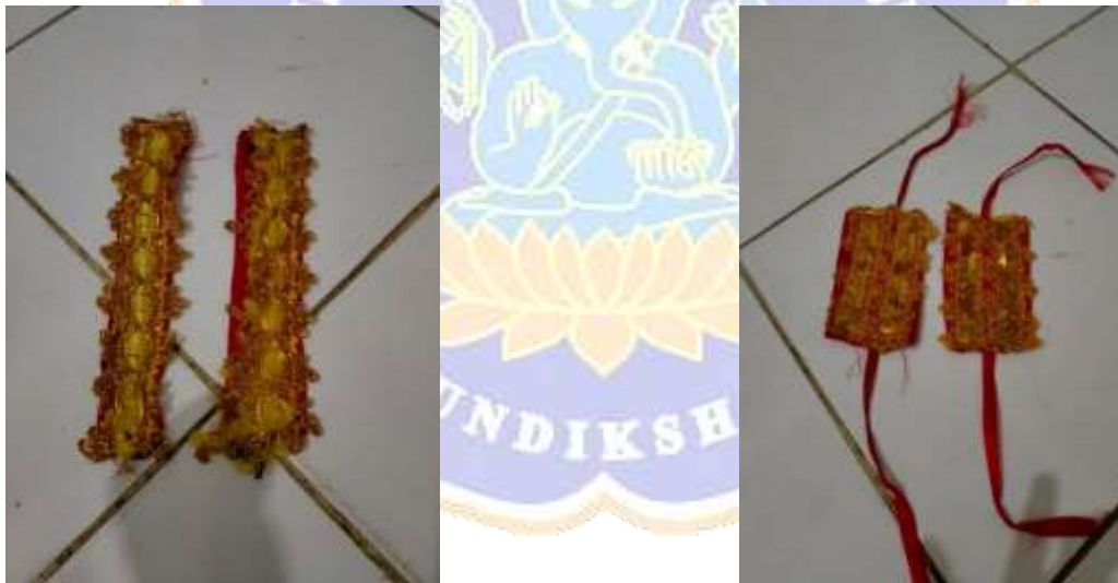
Figure14. satampa baju