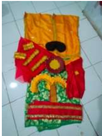
Figure 9. costumes