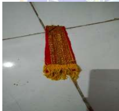
Figure11. jungge dondo