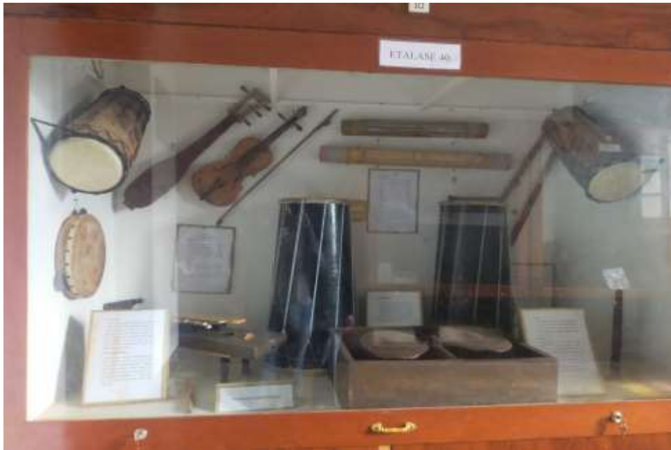
Figure20. musical instruments of Wura Bongi Monca dance