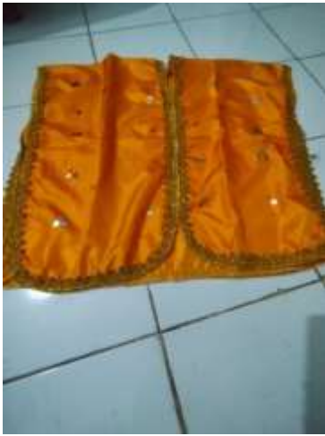
Figure15. baju poro