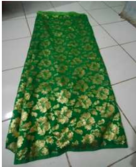
Figure13. tembe songket