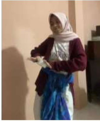
Figure5. leleballi bae