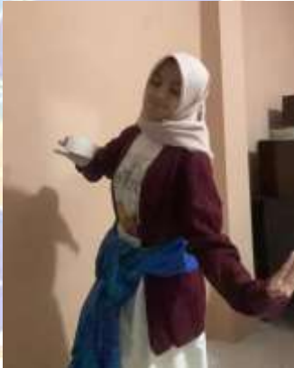
Figure 4. lelekui