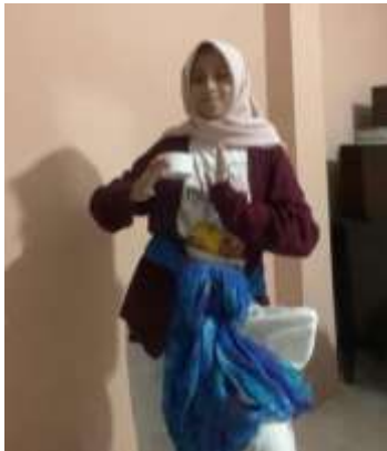
Figure 1. nemba