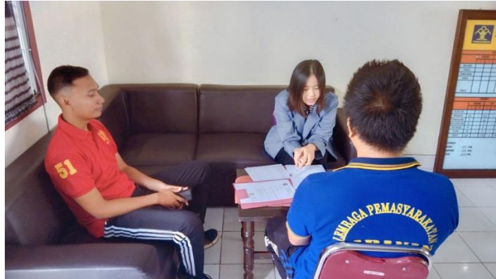
WAWANCARA DENGAN INFORMAN NARAPIDANA RESIDIVIS PENCURIAN I