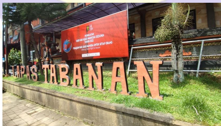
LEMBAGA PEMASYARAKATAN KELAS II B TABANAN