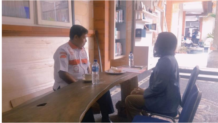
WAWANCARA DENGAN INFORMAN PEJABAT PEMASYARAKATAN I