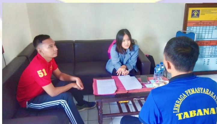
WAWANCARA DENGAN INFORMAN NARAPIDANA RESIDIVIS PENCURIAN III