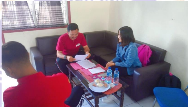
WAWANCARA DENGAN INFORMAN PEJABAT PEMASYARAKATAN II