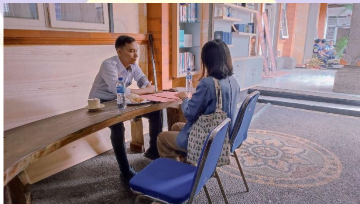
WAWANCARA DENGAN INFORMAN PEJABAT PEMASYARAKATAN III