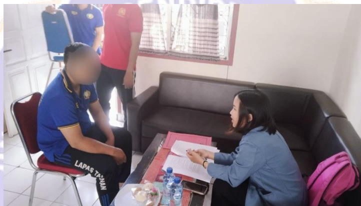
WAWANCARA DENGAN INFORMAN NARAPIDANA RESIDIVIS PENCURIAN II