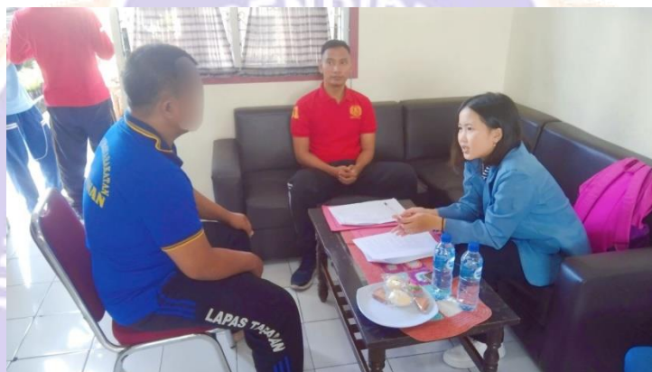
WAWANCARA DENGAN INFORMAN NARAPIDANA RESIDIVIS PENCURIAN V