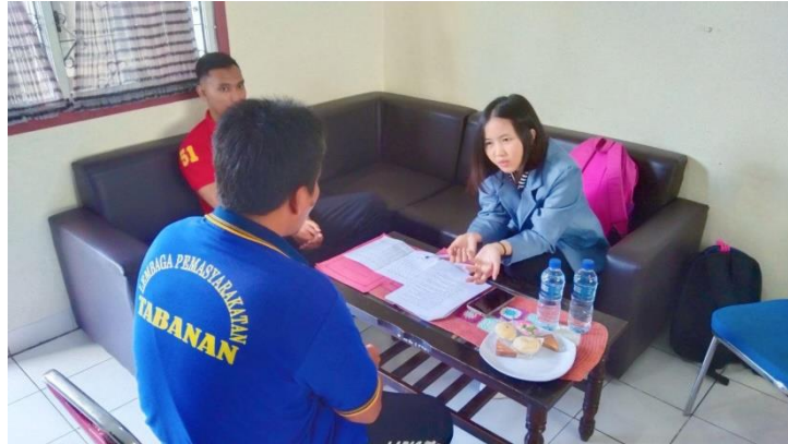
WAWANCARA DENGAN INFORMAN NARAPIDANA RESIDIVIS PENCURIAN IV