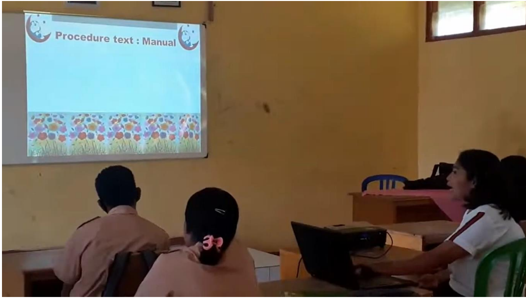
Learning procedure text