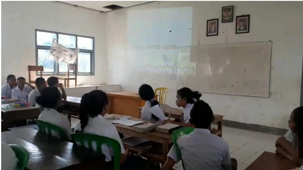
The students are listening to a song (listening)