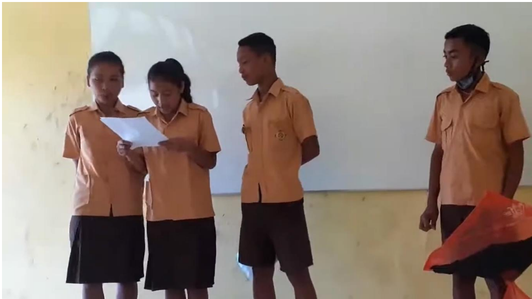
The students are presenting in front of class (speaking)