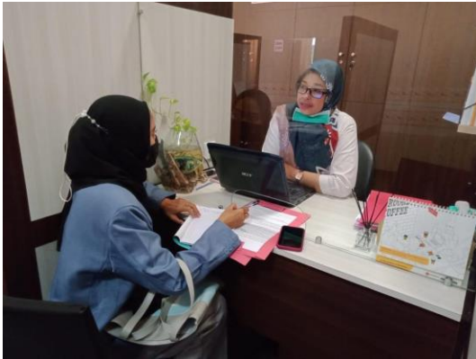
FOTO WAWANCARA DENGAN NARASUMBER