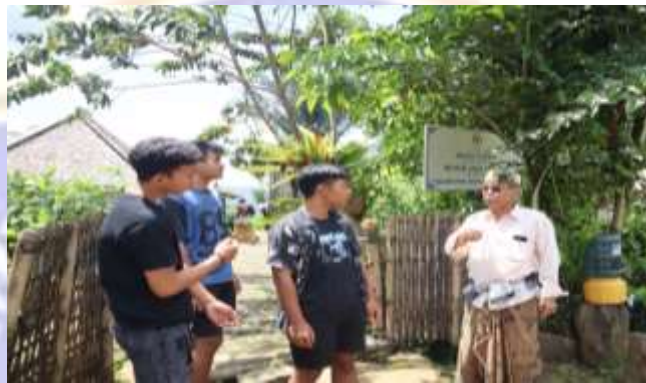
Gambar 01. Wawancara melalui Google Form dengan pengunjung (Sumber : Pengunjung, 2022)