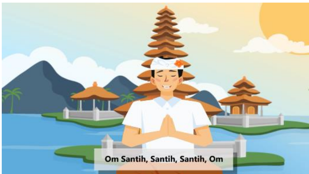
Gambar 15. Tampilan Penutup