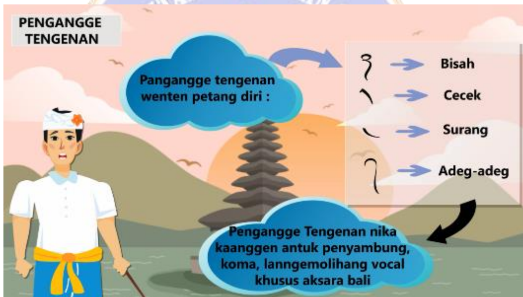
Gambar 12. Tampilan pengangge tengenan serta pengertian dan contoh aksara balinya.