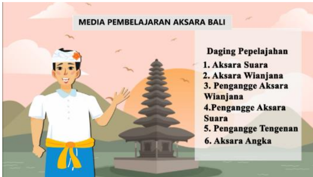
Gambar 3. Tampilan keenam materi yang akan di bahas.