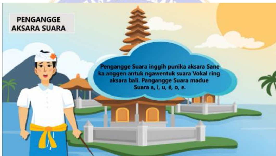
Gambar 10. Tampilan materi keempat.