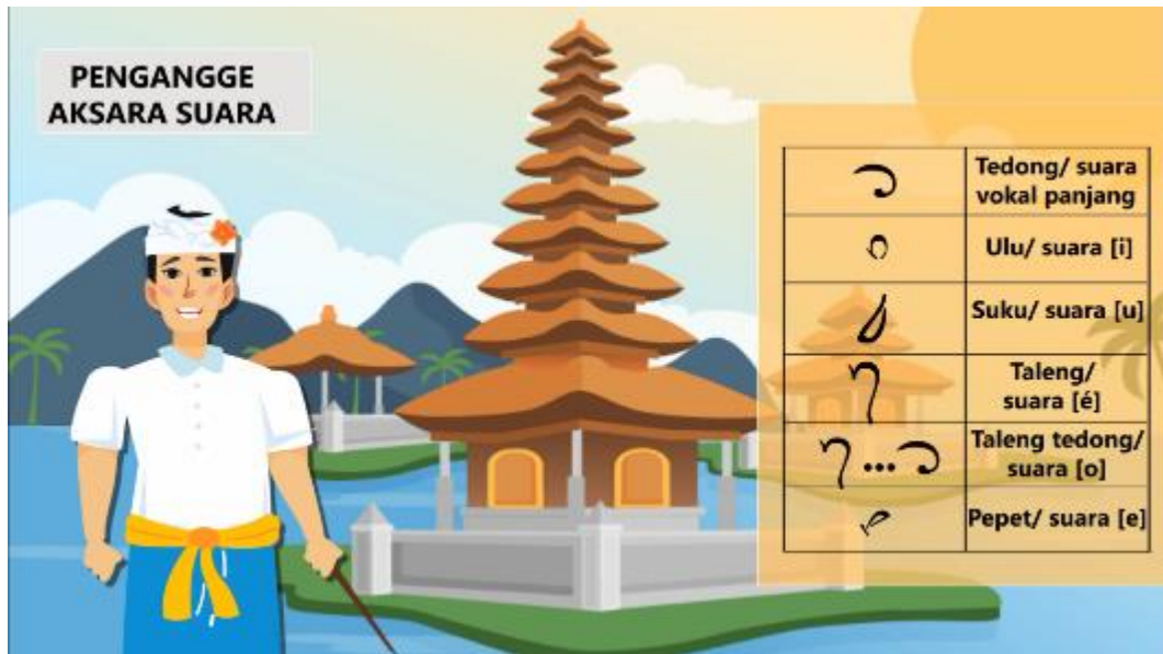
Gambar 11. Tampilan contoh pengangge aksara suara