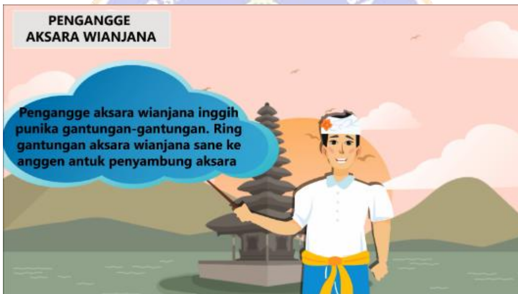
Gambar 8. Tampilan materi ketiga.