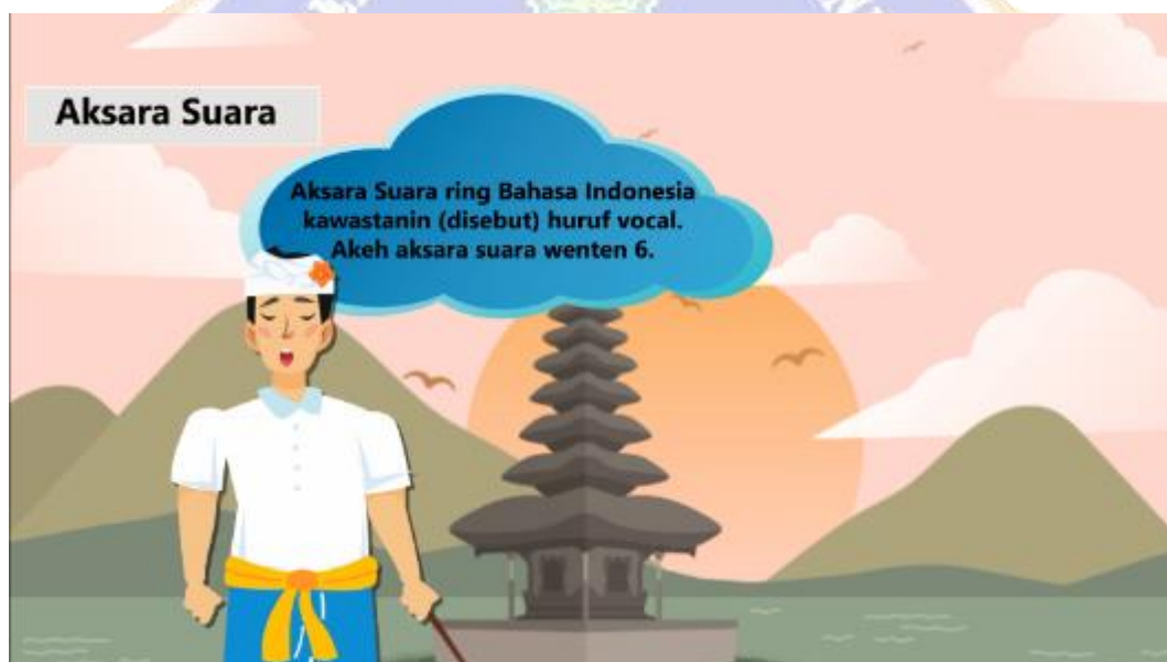
Gambar 4. Tampilan materi pertama.