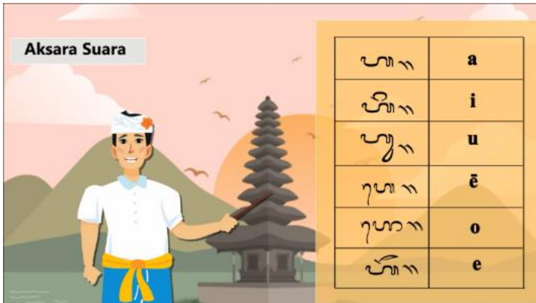
Gambar 5. Tampilan contoh aksara suara.