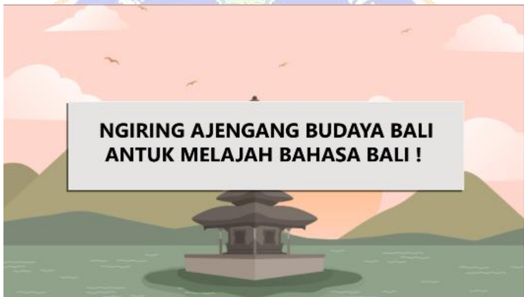
Gambar 14. Tampilan Slogan dan Pesan penutup.