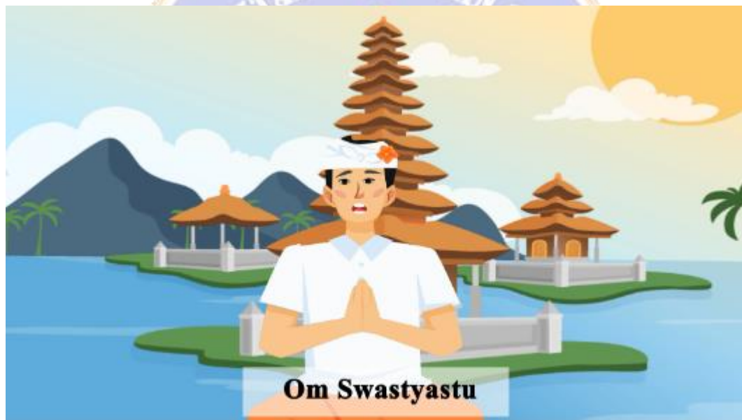
Gambar 2. Menampilkan Salam Kepada Penyimak.