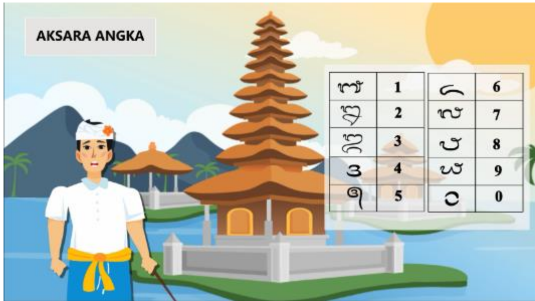
Gambar 13. Tampilan materi keenam serta contoh angka latin dalam aksara balinya.