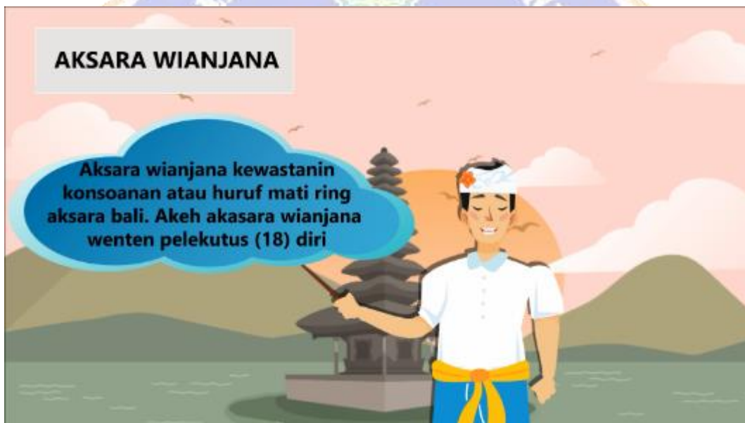
Gambar 6. Tampilan materi kedua.