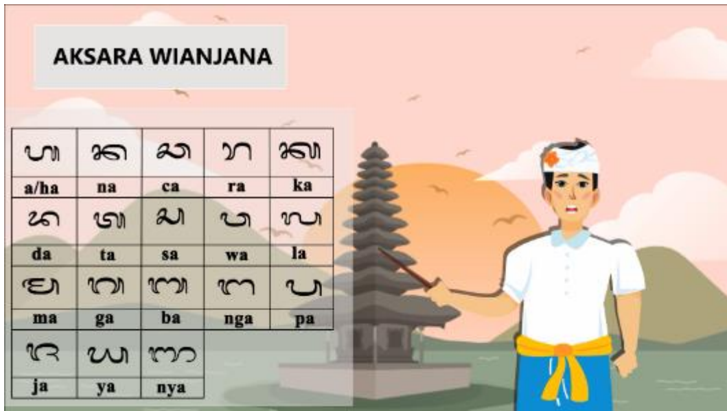
Gambar 7. Tampilan contoh aksara wianjana