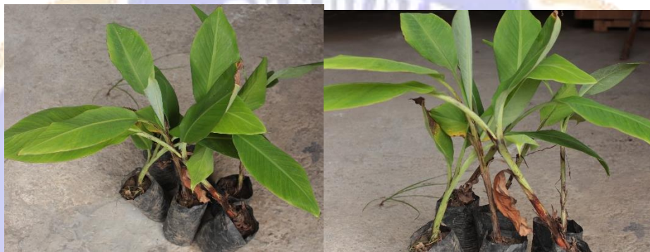
Dokumentasi foto bibit pisang dari kultur jaringan