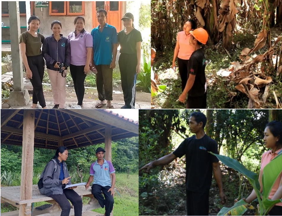
Dokumentasi foto observasi sekaligus wawancara dengan Ketua Kelompok Tani Ternak Kerti Winangun dan Kelompok Wanita Tani Ternak Kerti Winangun