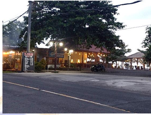
Dokumentasi Foto Beberapa Penginapan, Warung kecil dan Restoran