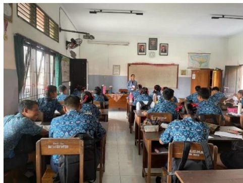
Gambar 3. Uji Soal di Kelas IX A