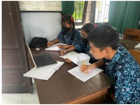
Gambar 7. Uji Coba Kelompok Kecil (Sedang)