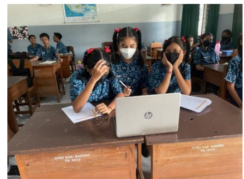
Gambar 6. Uji Coba Kelompok Kecil (Tinggi)