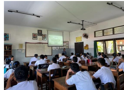
Gambar 10. Penayangan Media