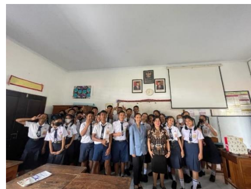
Gambar 12. Foto Bersama