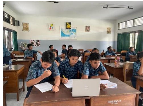
Gambar 8. Uji Coba Kelompok Kecil (Rendah)