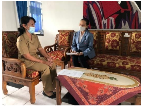
Gambar 1. Kegiatan Wawancara