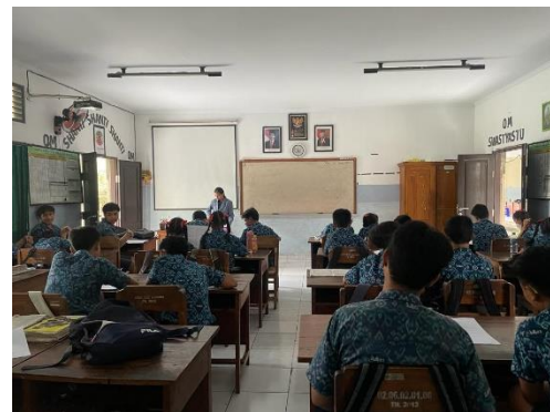
Gambar 4. Uji Soal di Kelas IX D