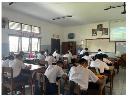
Gambar 11. Kegiatan Posttest