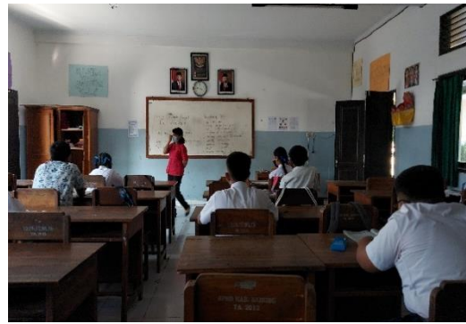
Gambar 2. Kegiatan Observasi