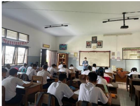
Gambar 9. Kegiatan Pretest