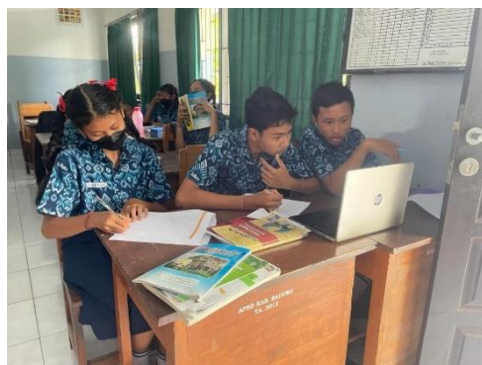
Gambar 5. Uji Coba Perorangan