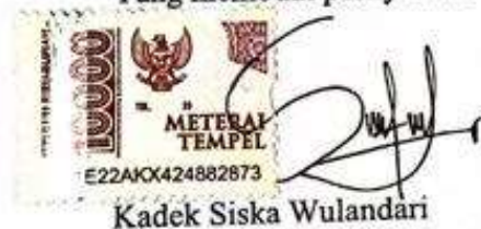
Kadek Siska Wulandari