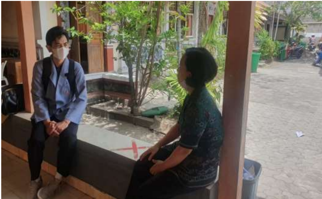
(SD Negeri 2 Banyuning)