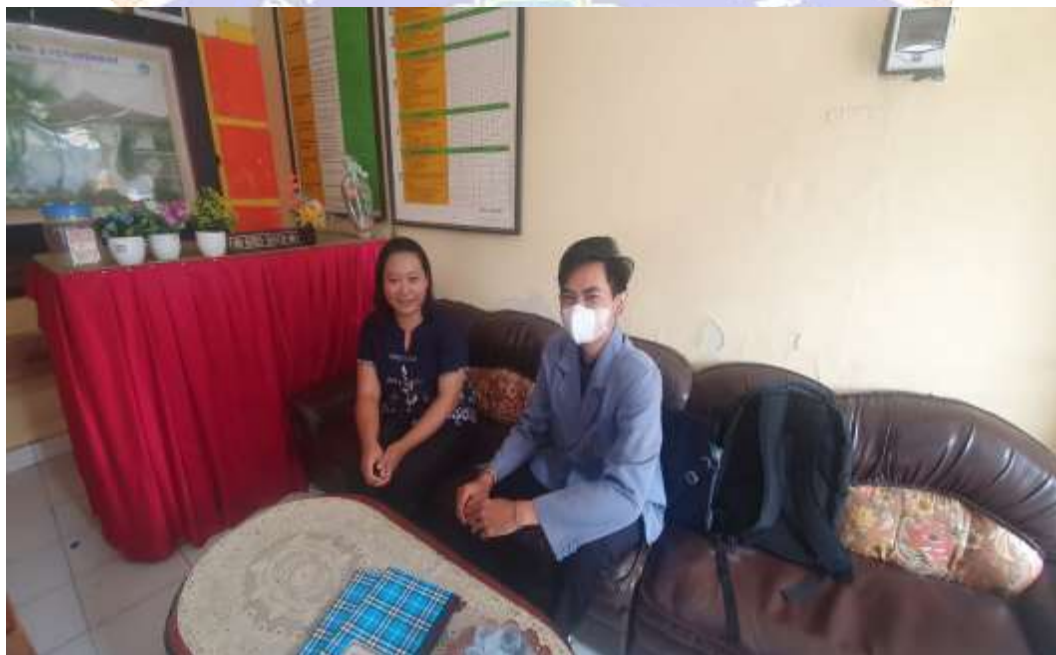
(SD Negeri 2 Petandakan)