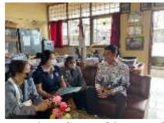
Penyerahan Surat Observasi dan Pelaksanaan Wawancara Bersama Dengan Kepala Sekolah SDN 3 Banyuasri