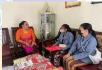
Penyerahan Surat Observasi dan Pelaksanaan Wawancara Bersama Dengan Guru di SDN 4 Banyuasri