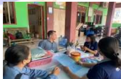
Penyerahan Surat Observasi dan Pelaksanaan Wawancara Bersama Dengan Wali Kelas IV di SD Muhammadiyah