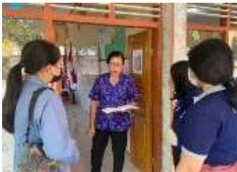
Penyerahan Surat Observasi dan Pelaksanaan Wawancara Bersama Dengan Wali Kelas IV di SDN 1 Banyuasri