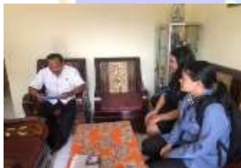
Penyerahan Surat Observasi dan Pelaksanaan Wawancara Bersama Dengan Kepala Sekolah SDN 4 Banyuasri