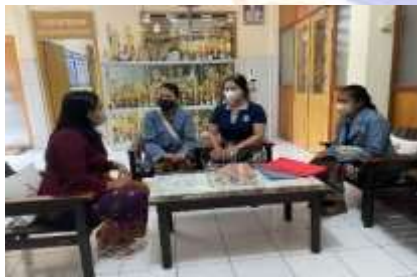
Penyerahan Surat Observasi dan Pelaksanaan Wawancara Bersama Dengan Guru SD Karya