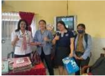
Penyerahan Surat Observasi dan Pelaksanaan Wawancara Bersama Dengan Kepala Sekolah SDN 1 Banyuasri