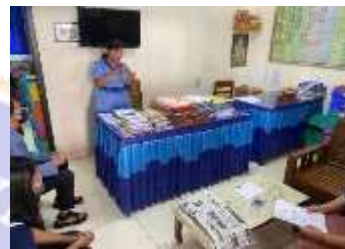
Penyerahan Surat Observasi dan Pelaksanaan Wawancara Bersama Dengan Kepala Sekolah SD Lab Undiksha