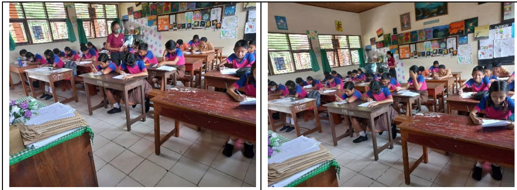
Penyebaran kuisisioner uji coba