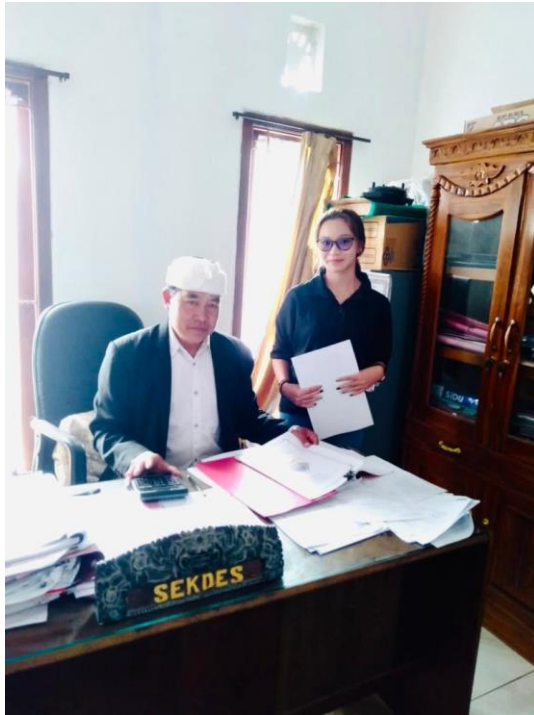
Dokumentasi Wawancara kepada Kepala Desa Candikuning yang saat itu diwakilkan oleh Sekretaris Desa Candikuning