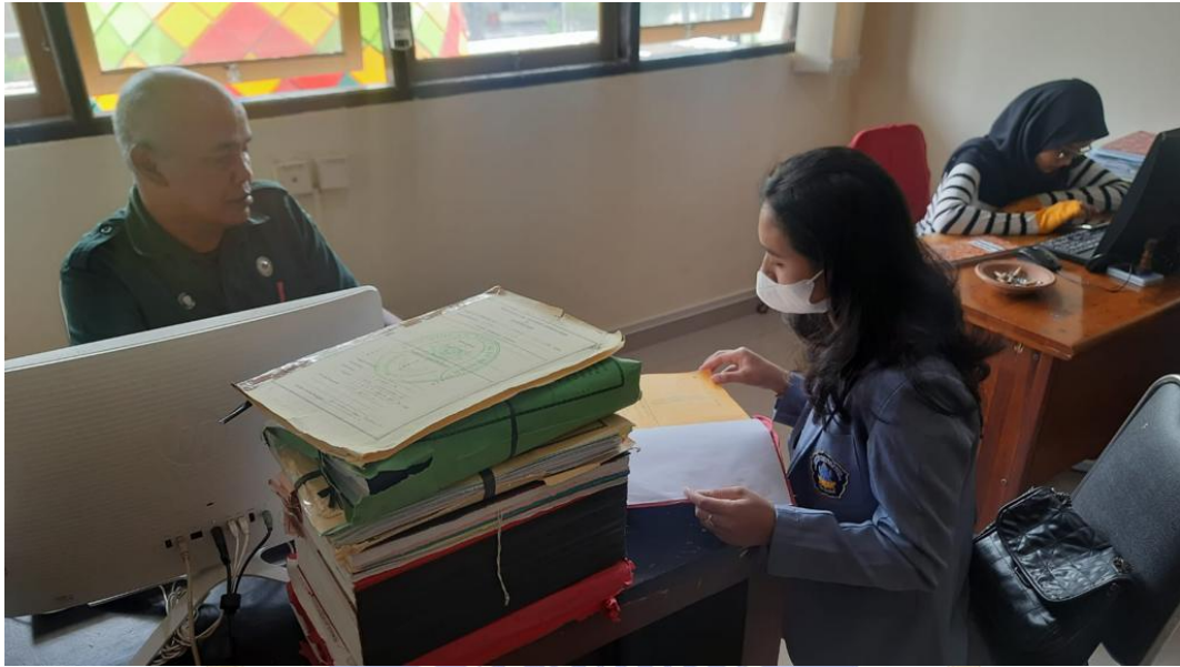
FOTO WAWANCARA DENGAN NARASUMBER 3