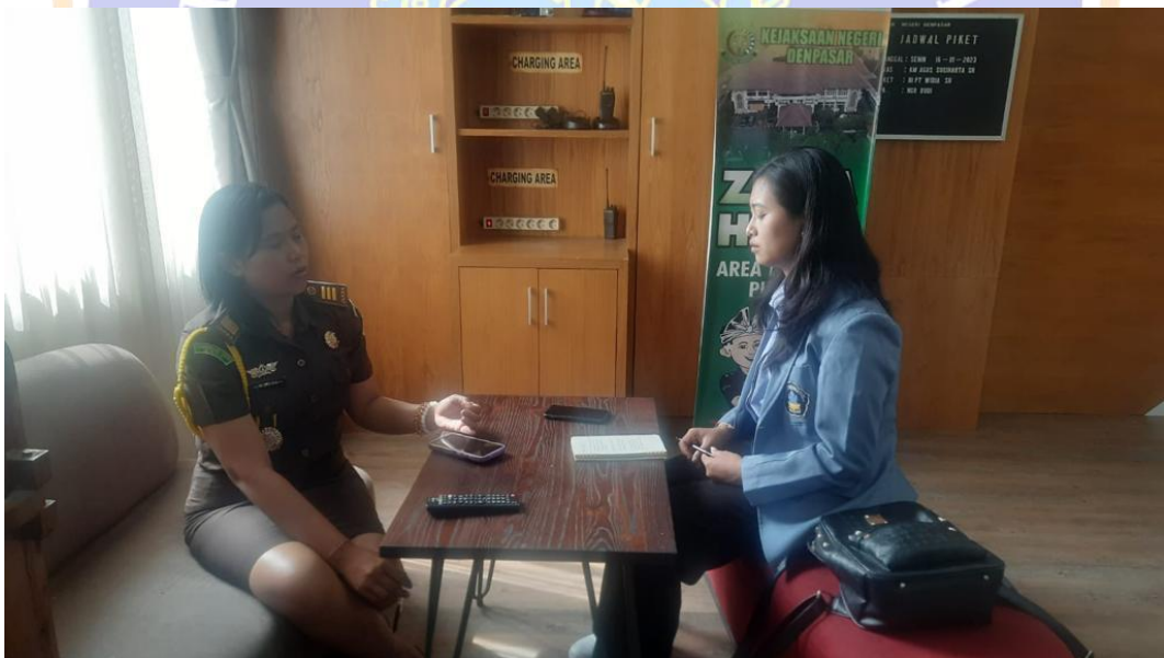
FOTO WAWANCARA DENGAN NARASUMBER 2