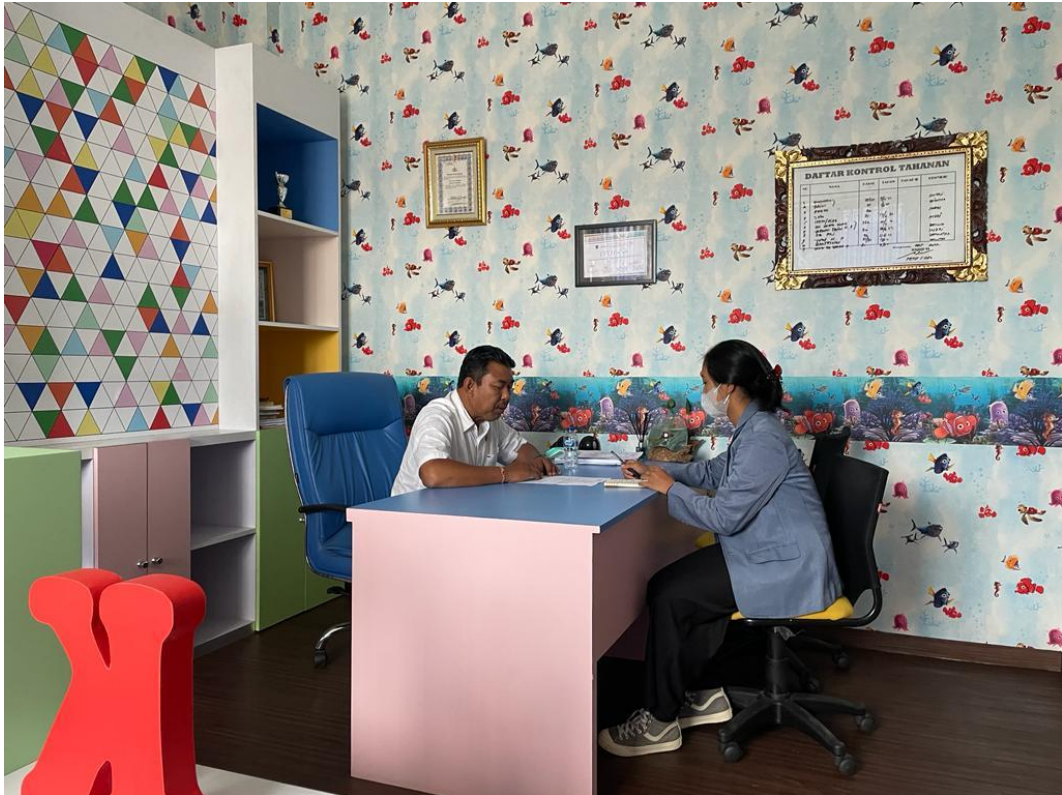
FOTO WAWANCARA DENGAN NARASUMBER 1