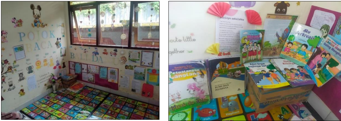
Foto 08. Penataan Ruang Pojok Baca