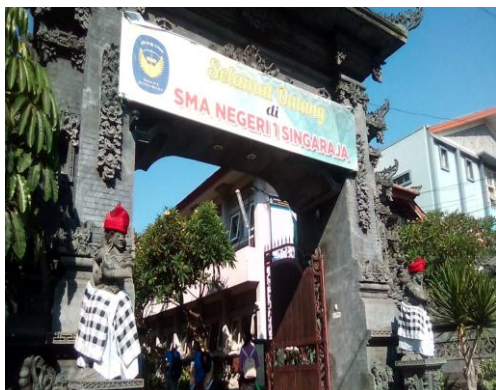
Gambar 09. Lokasi Penelitian SMA N 1 sekolah