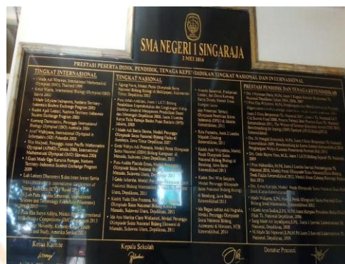
Gambar 10. Prestasi yang dicapai