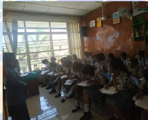
Gambar 04. Penyebaran Kuesioner Kelas XI Ilmu-ilmu Sosial