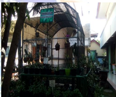
Gambar 12. Tanaman Obat di