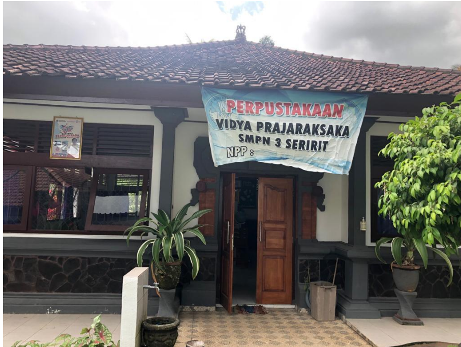
Gambar 1. Gedung Perpustakaan SMP Negeri 3 Seririt