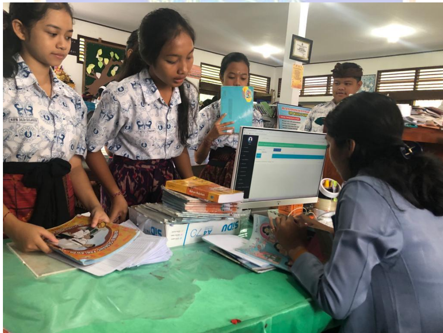
Gambar 6. Layanan Sirkulasi (Peminjaman, pengembalian dan perpanjangan bahan pustaka melalui aplikasi SLiMS ( Seanayan Library Management System ) SMP Negeri 3 Seririt