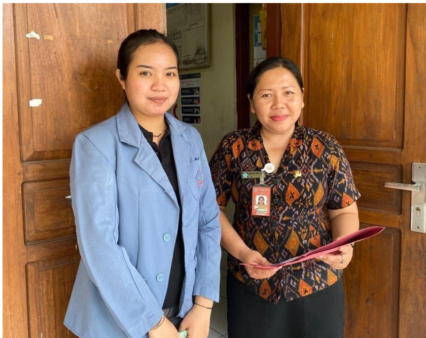
Penyebaran Kuesioner di SDN 15 Pemecutan