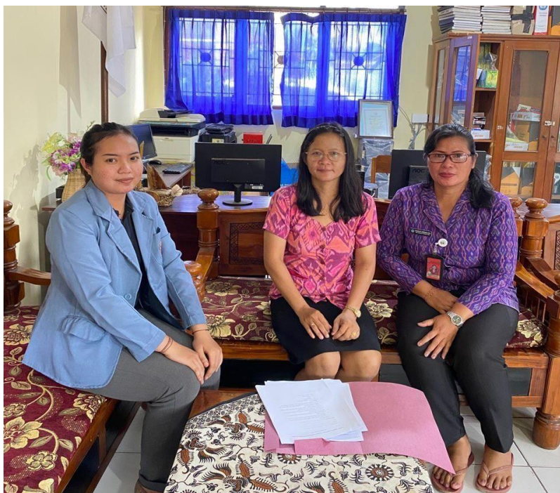
Penyebaran Kuesioner di SDN 26 Pemecutan