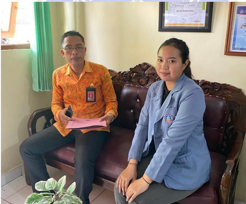
Penyebaran Kuesioner di SDN 32 Pemecutan