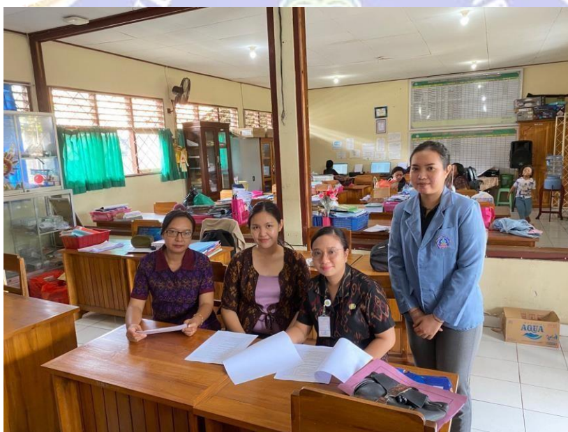
Penyebaran Kuesioner di SDN 19 Pemecutan