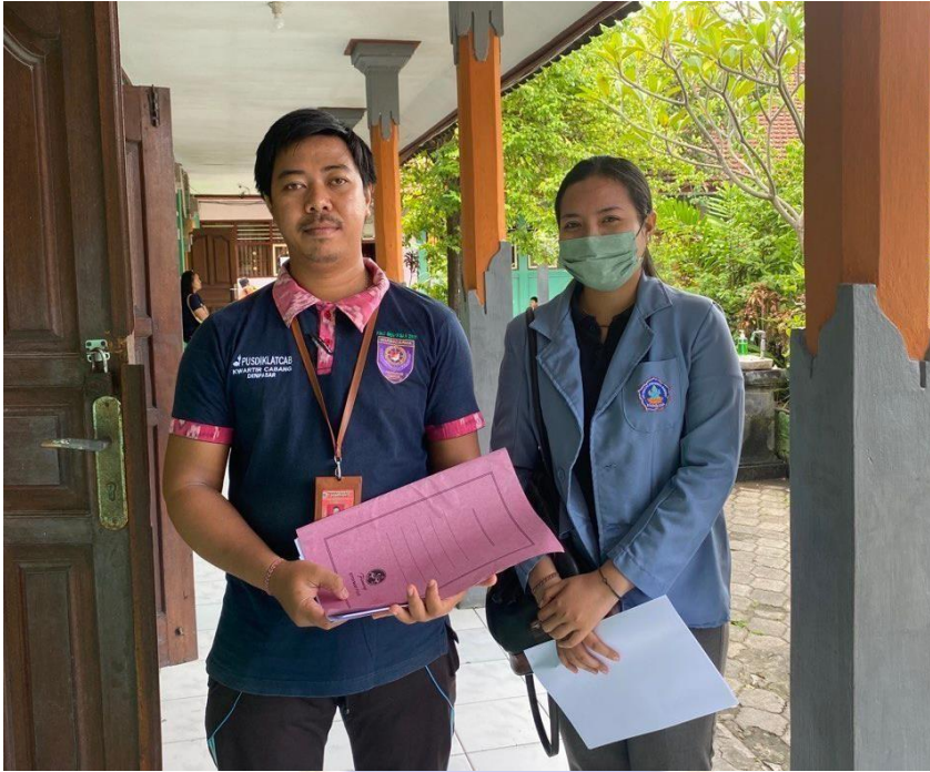
Penyebaran Kuesioner di SDN 27 Pemecutan