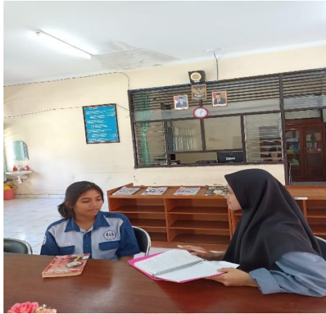
Gambar 3 Kegiatan Wawancara dengan Siswa SMK Negeri 3 Singaraja