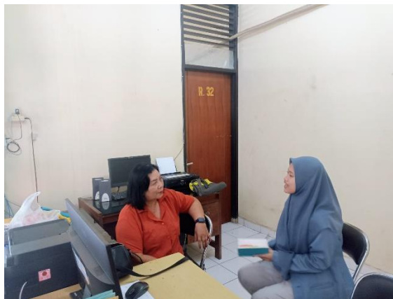
Gambar 1 Kegiatan Wawancara Bersama Pustakawan Perpustakaan Abirama Widya Teknika SMK Negeri 3 Singaraja