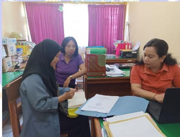
Gambar 6 Kegiatan Wawancara Dengan Admin Bendahara BOS SMK Negeri 3 Singaraja