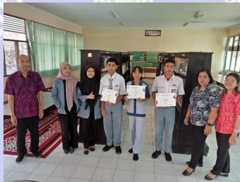
Gambar 4 Kegiatan Promosi Perpustakaan Abirama Widya Teknika SMK Negeri 3 Singaraja