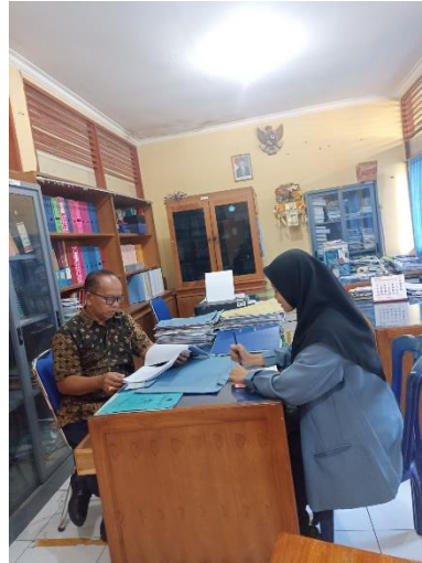
Gambar 5 Kegiatan Wawancara Dengan WKS 1 SMK Negeri 3 Singaraja