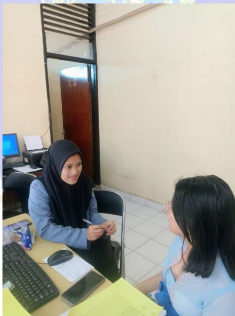
Gambar 2 Kegiatan Wawancara dengan Pegawai Perpustakaan Abirama Widya Teknika SMK Negeri 3 Singaraja