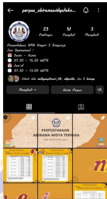
Gambar 9 Akun Sosial Media Perpustakaan Abirama Widya Teknik SMK Negeri 3 Singaraja