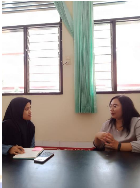
Gambar 7 Kegiatan Wawancara Bersama Guru Bahasa Indonesia SMK Negeri 3 Singaraja