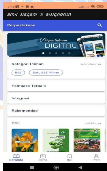
Gambar 8 Aplikasi Perpustakaan Digital Perpustakaan Abirama Widya Teknika SMK Negeri 3 Singaraja