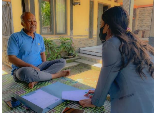
Gambar 01. Wawancara dengan Kepala Desa