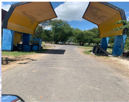
Gambar 02. Akses jalan Bendungan Pengga