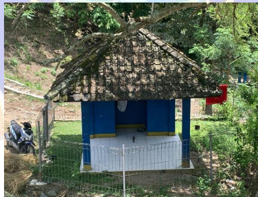
Gambar 03. Mushola Bendungan Pengga