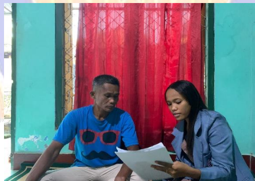
Gambar 02. Wawancara dengan pihak pengelola.