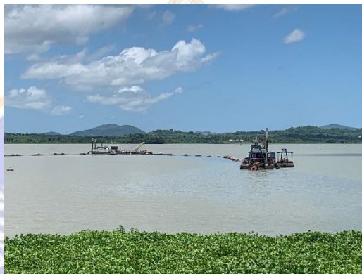
Gambar. 06 Batas Bagi Pengguna Perahu