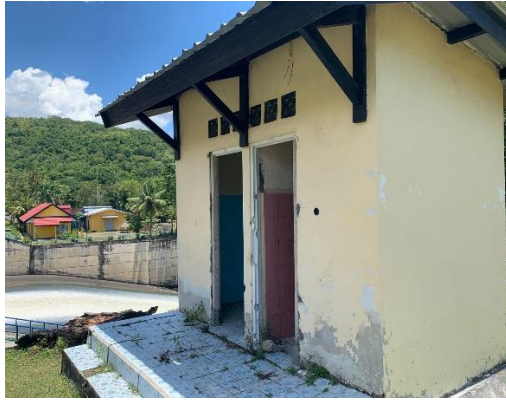
Gambar 05. Fasilitas Kamar Mandi Bendungan Pengga