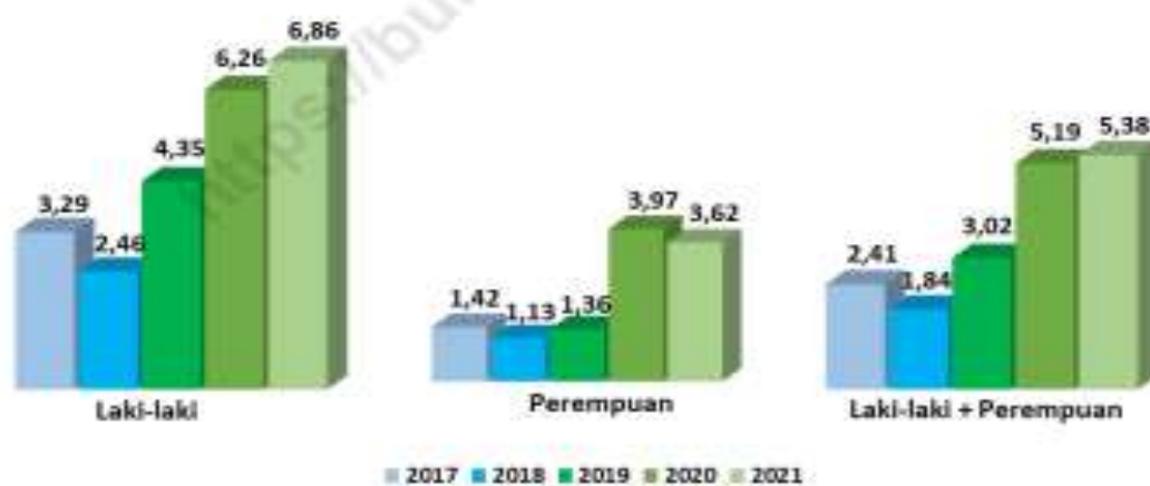
Gambar 5.1. Tingkat Pengangguran Terbuka (TPT) di Kabupaten Buleleng menurut Jenis Kelamin, 2017-2021

Sumber: Badan Pusat Statistik, Sakernas 2017 – 2021