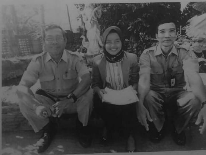
Dokumentasi wawancara guru penjas