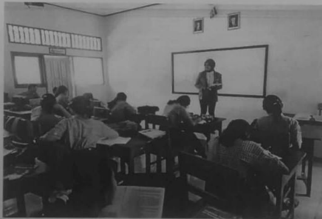
Dokumentasi Pengumpulan data