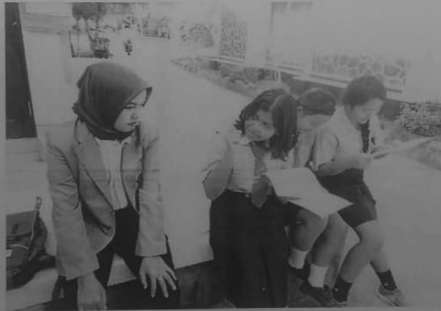
Dokumentasi wawancara siswa SMA Negeri 1 Sawan