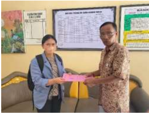
7. Penyerahan Surat Penelitian