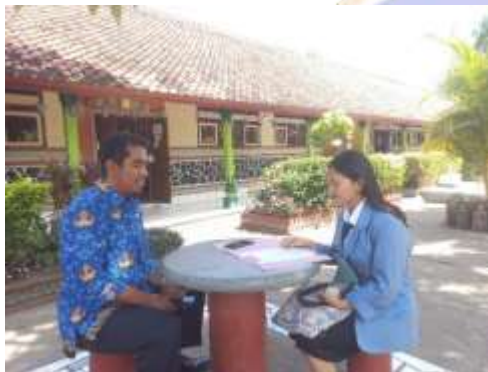
3. Pelaksanaan Wawancara