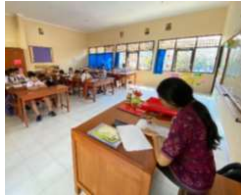
8. Pengisian Kuisisioner