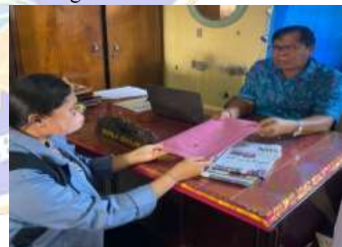
6. Penyerahan Surat Penelitian