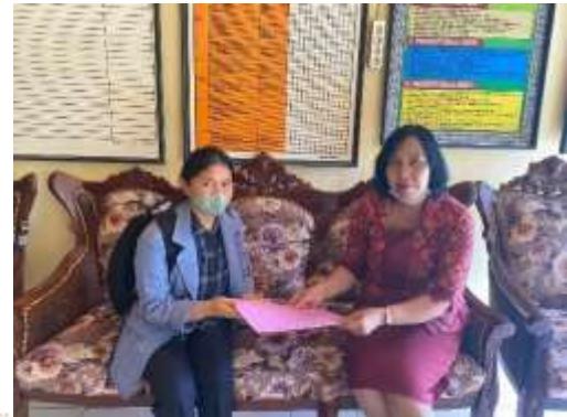
2. Penyerahan Surat Observasi