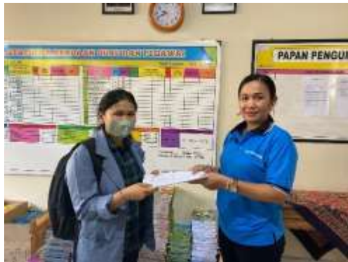
1. Penyerahan Surat Observasi