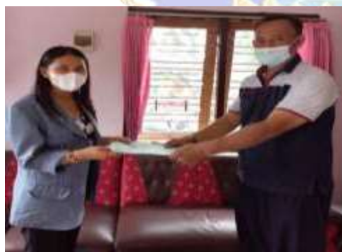
5. Penyerahan Surat Penelitian