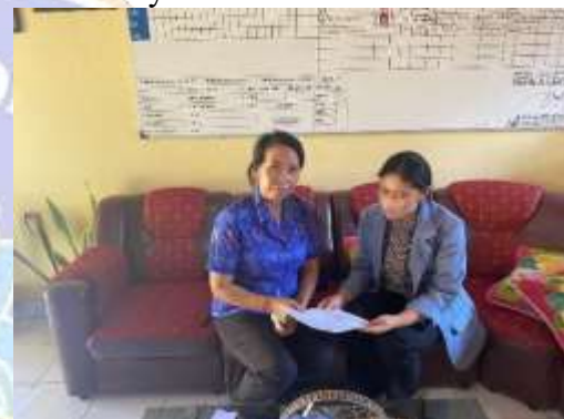
4. Pengisian Kuisioner