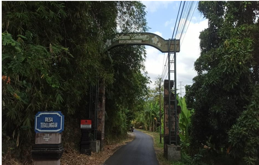
Dokumentasi pintu masuk Desa Tegallingham