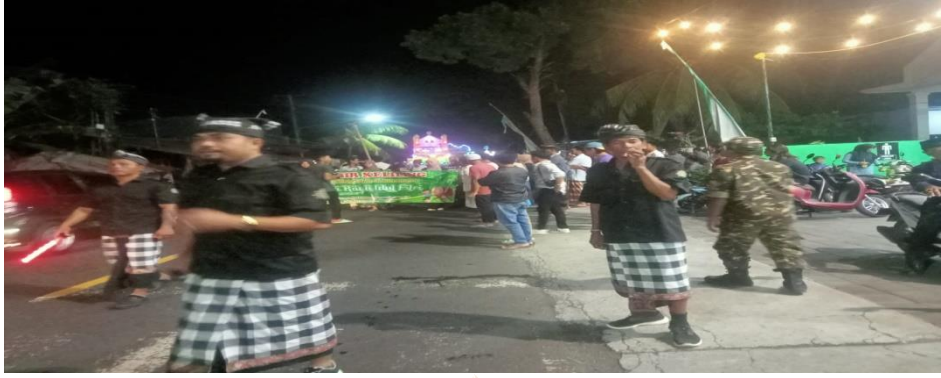
Dokumentasi Pawai ogoh-ogoh di Desa Tegallingham