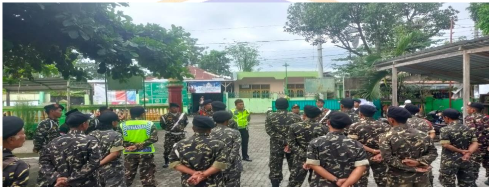
Dokumentasi Apel atau arahan Kasatkoryon Tegallingham sebelum pengamanan berlangsung