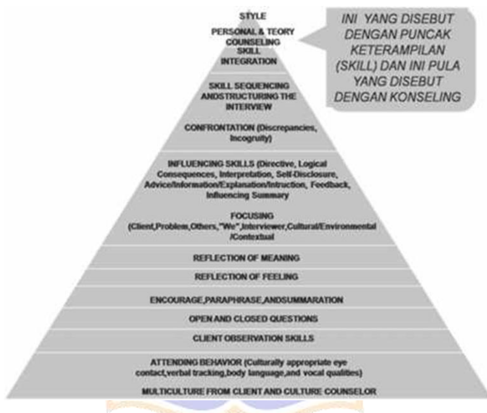
Gambar 1. Keterampilan dasar mikro konseling

Keterampilan konseling yang harus dimiliki oleh seorang konselor menurut Dharsana (2018) yaitu :