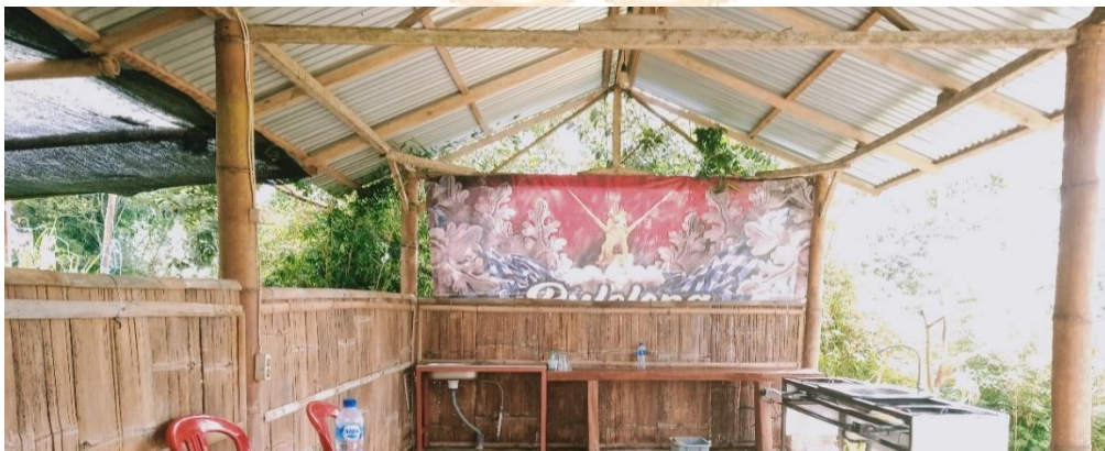
Foto 3. Area Cooking Class