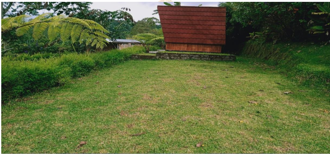
Foto 4. Lahan Camping Agrowisata Linggayoni