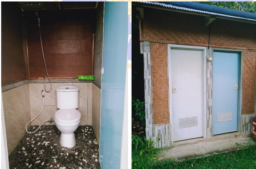
Foto 5. Toilet Agrowisata Linggayoni