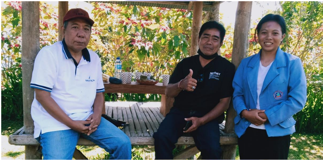
Foto 6. Dokumentasi Wawancara