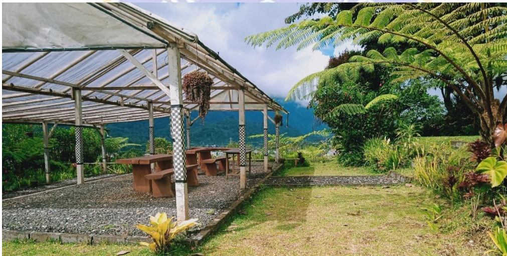
Foto 2. Tempat Bersantai