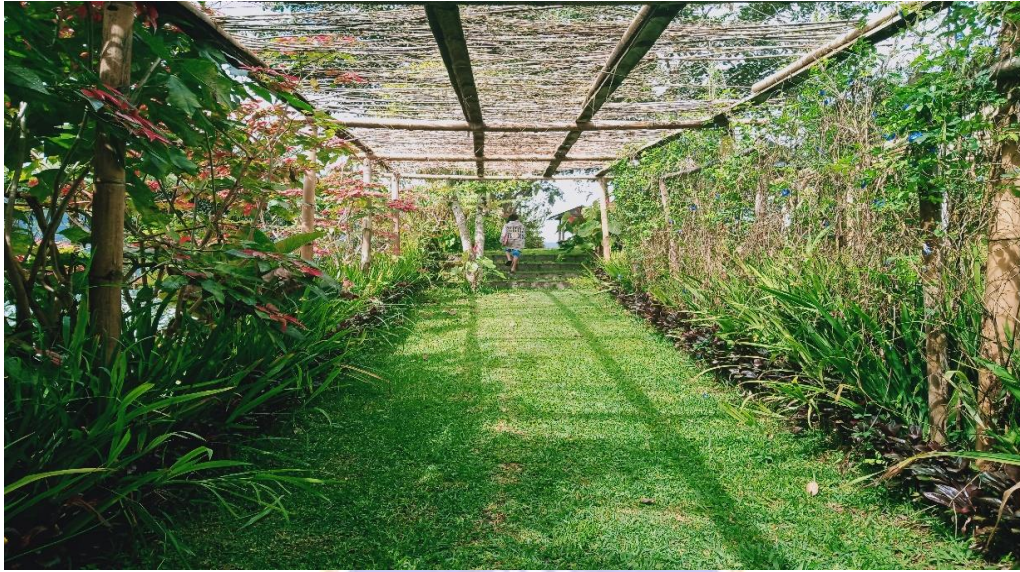
Foto 1. Pintu Masuk Menuju Kawasan Bagian Atas