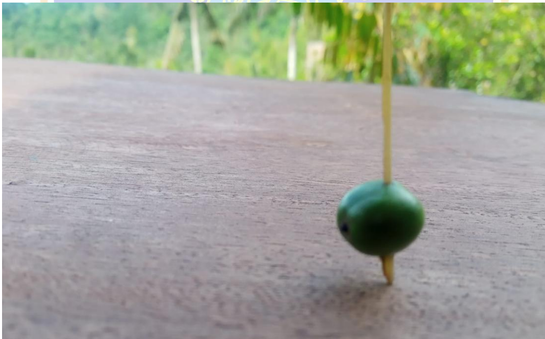
(Gambar 2. Gangsing kiper untuk menyimpulkan anak perempuan)