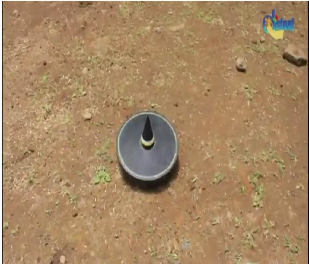
(Gambar.10 Foto Bermain Gangsing)