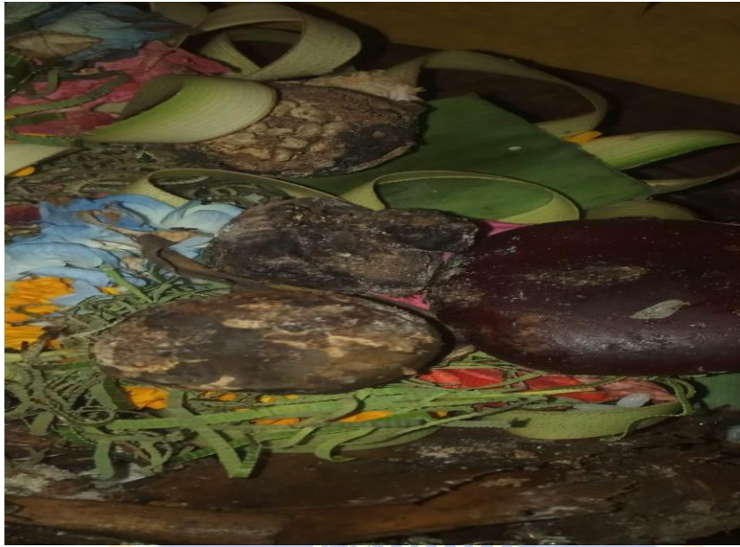
(Gambar 7. Foto gangsing di plangkiran)