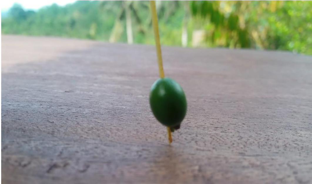
(Gambar 3. Gangsing Lonjong untuk menyimpulkan anak laki-laki)