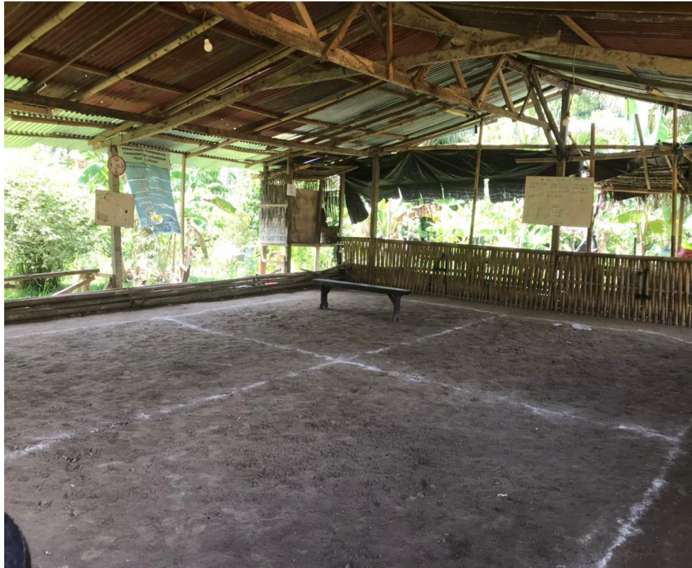
(Gambar.9 Foto Lapangan Gangsing)