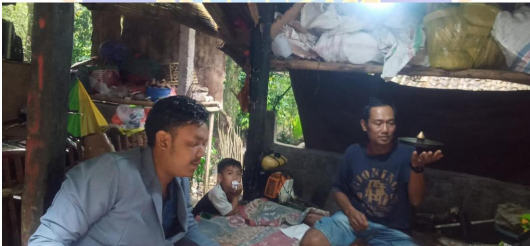
(Gambar 6. Wawancara dengan pemain gangsing)