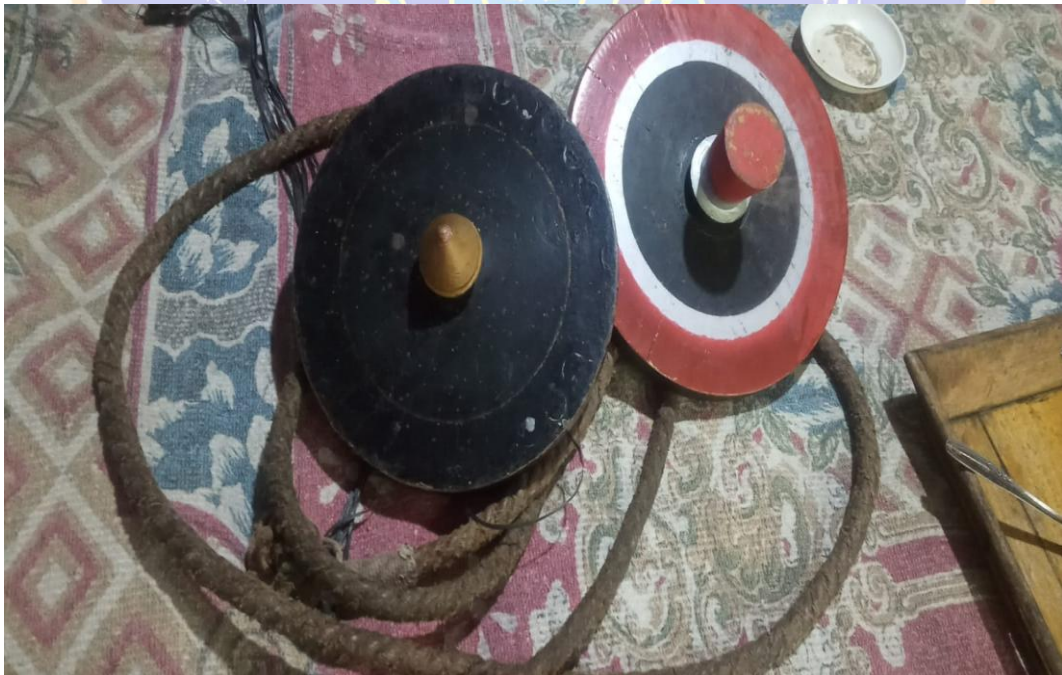
(Gambar 4. Jenis Gangsing pengebug atau di sebut ganggsing megebug)