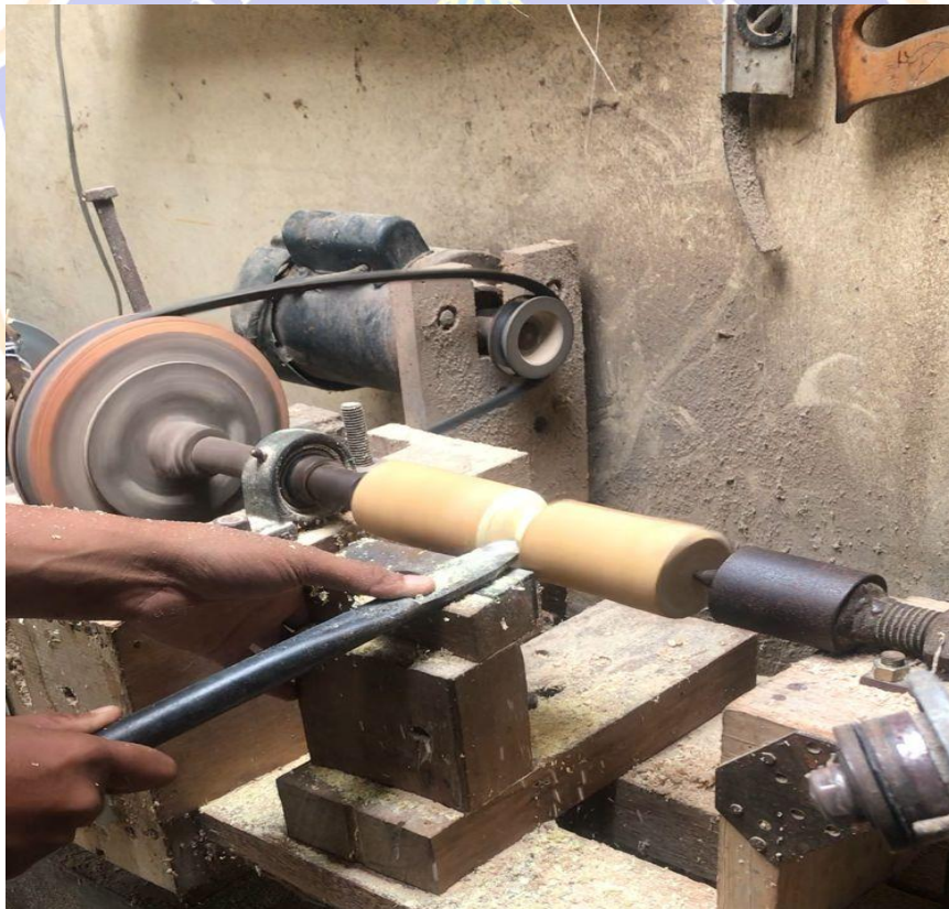
(Gambar 8. Foto Proses Pembuatan Gangsing)