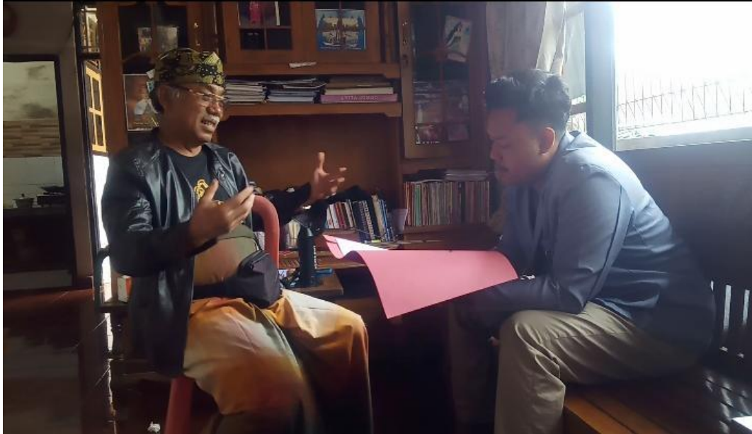
(Gambar 1. Proses Interview dengan tokoh sejarah Gangsing Desa)