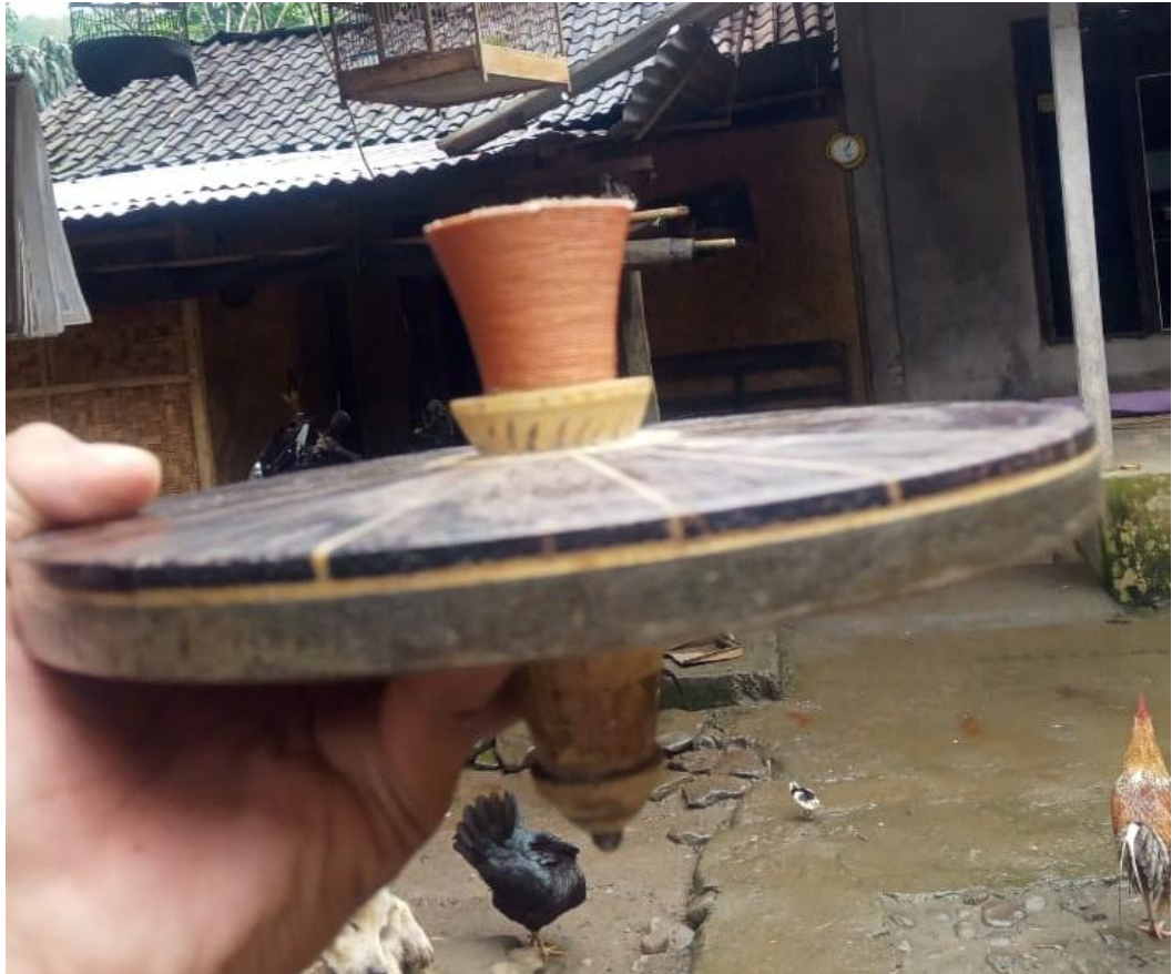
(Gambar 5. Jenis Gangsing pemelek atau pemasang )