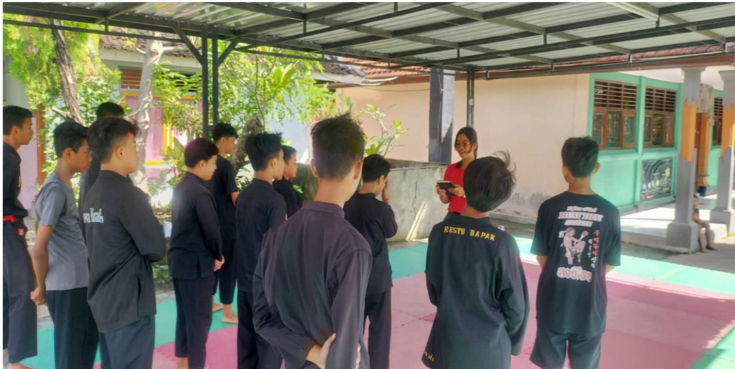
Gambar 02. Pemanasan di Aula SMP Sapta Andika Denpasar