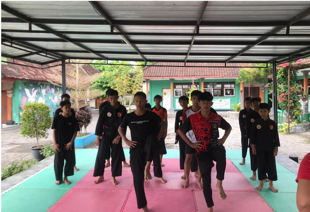
Gambar 07. Posttest Kekuatan Otot Perut