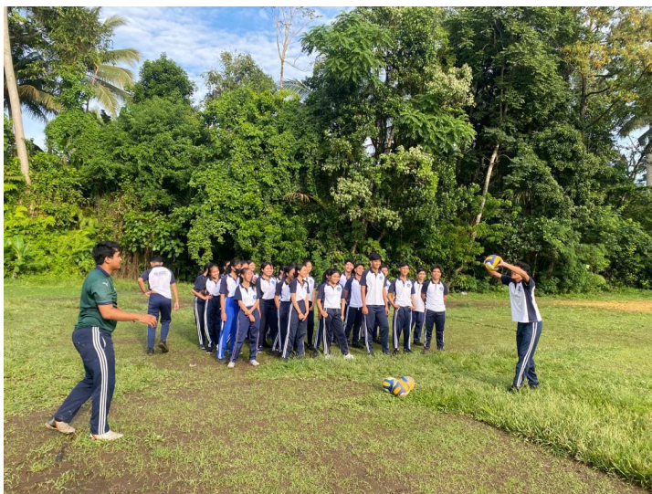
8. Dokumentasi keterampilan passing bawah bola voli