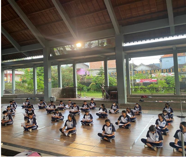
6. Dokumentasi tes pengetahuan passing control sepak bola