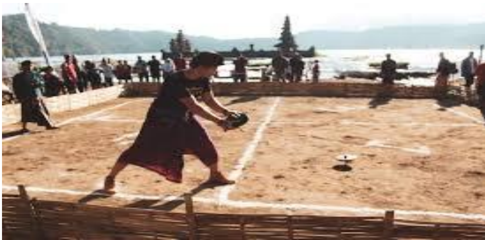
Foto Bermain Gangsing