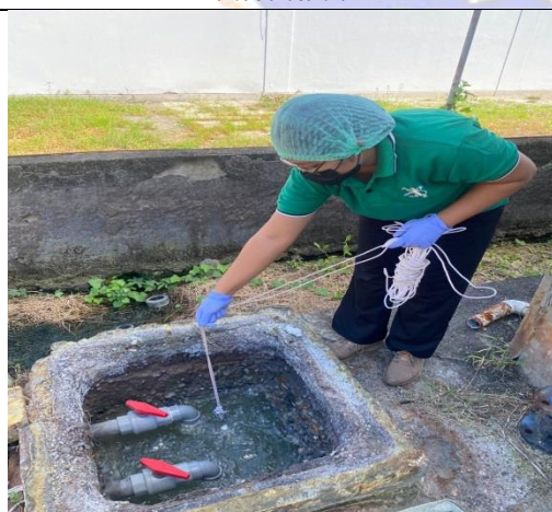
Gambar 5. Pengambilan sampel pada DO tank