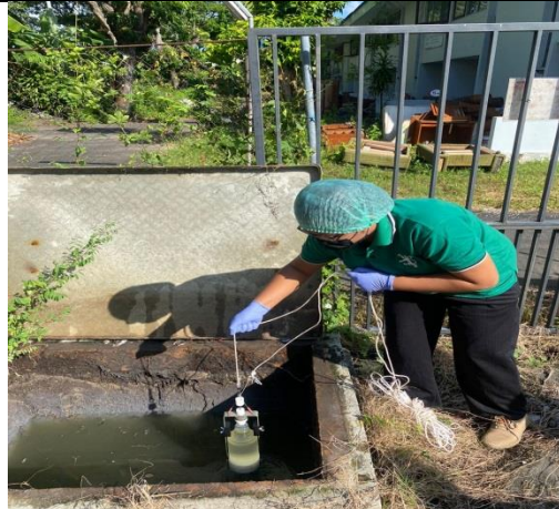
Gambar 3. Pengambilan sampel pada inlet tank