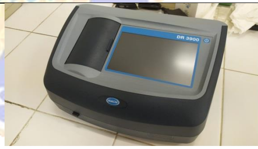
Gambar 12. Spektrofotometer DR 3900 untuk pengujian COD