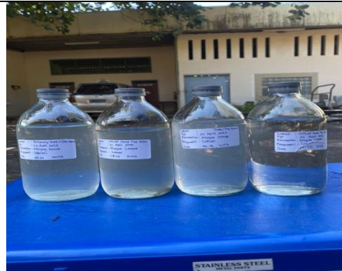
Gambar 8. Wadah sampel untuk pengujian parameter minyak & lemak