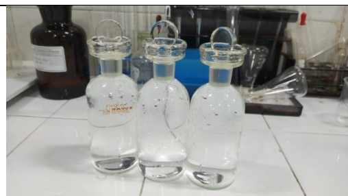
Gambar 14. Pengujian BOD