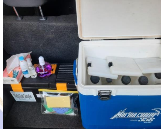
Gambar 2. Peralatan sampling