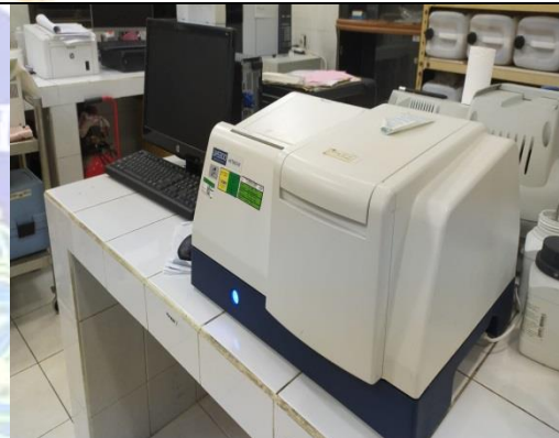
Gambar 10. Spektrofotometer UH5300 HITACHI untuk pengujian amonia