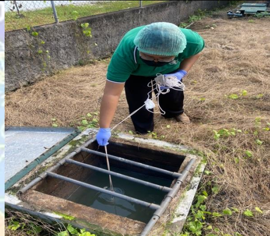
Gambar 4. Pengambilan sampel pada primary tank