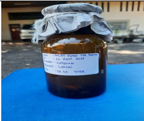
Gambar 9. Wadah sampel untuk pengujian parameter Coliform