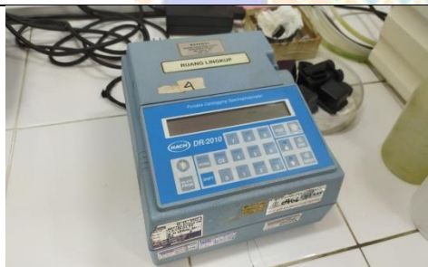
Gambar 11. Spektrofotometer HACH DR/2010 untuk pengujian TSS