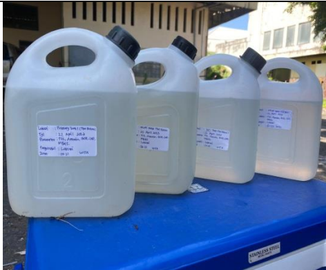
Gambar 7. Wadah sampel pengujian parameter TSS, amonia, BOD, COD, dan MBAS