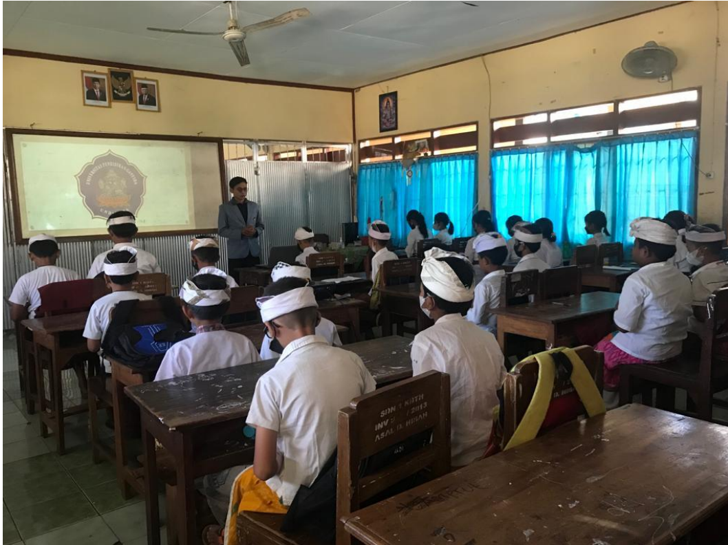
Lampiran 26. Dokumentasi uji coba perorangan dan kelompok