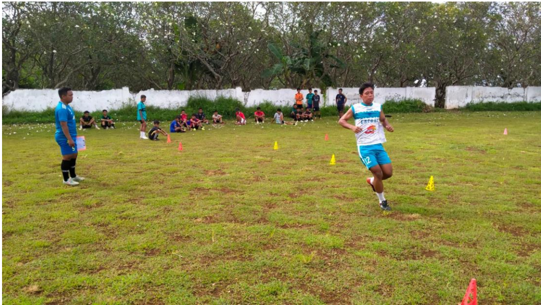
Gambar 3. Illinois Agillity Run Test