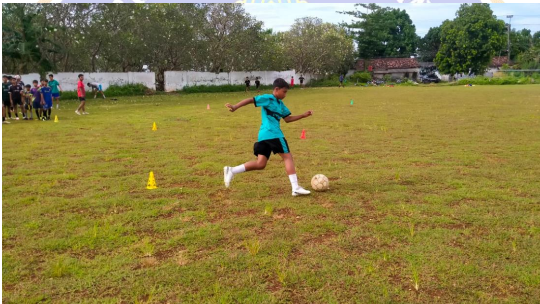
Gambar 4. Tes menggiring bola