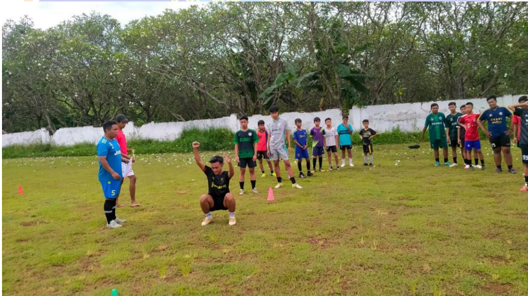
Gambar 2. Standing broad jump