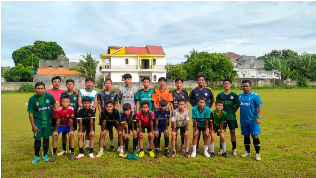
Gambar 5. Berfoto Bersama setelah melakukan penelitian