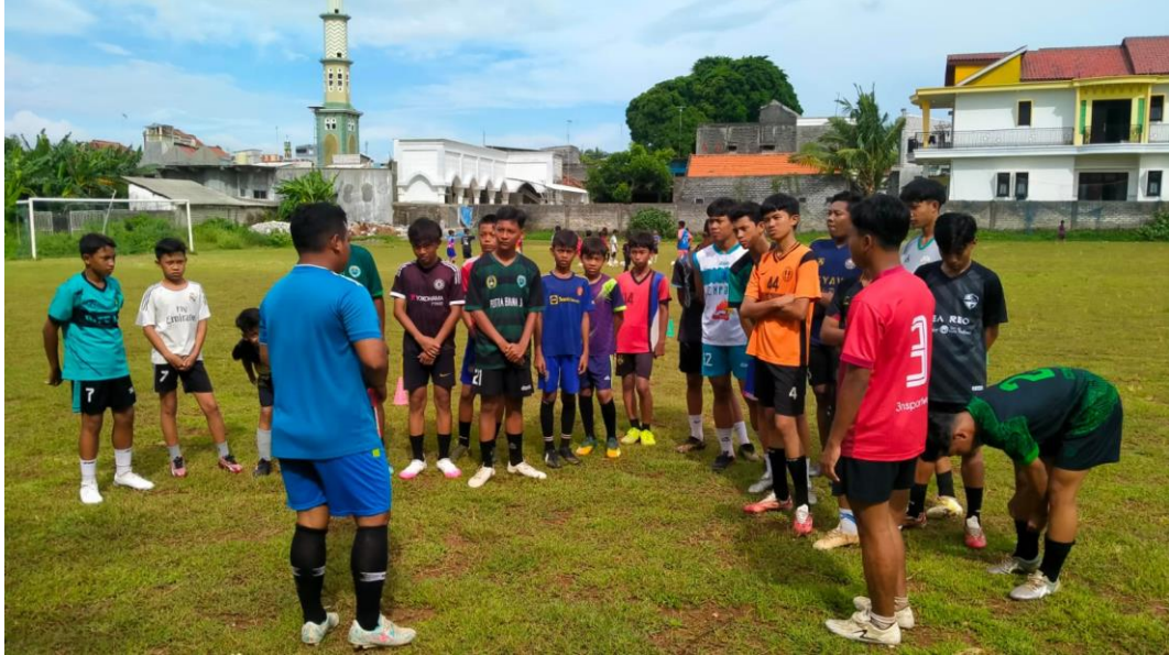
Gambar 1. Pengarahan kepada subjek penelitian