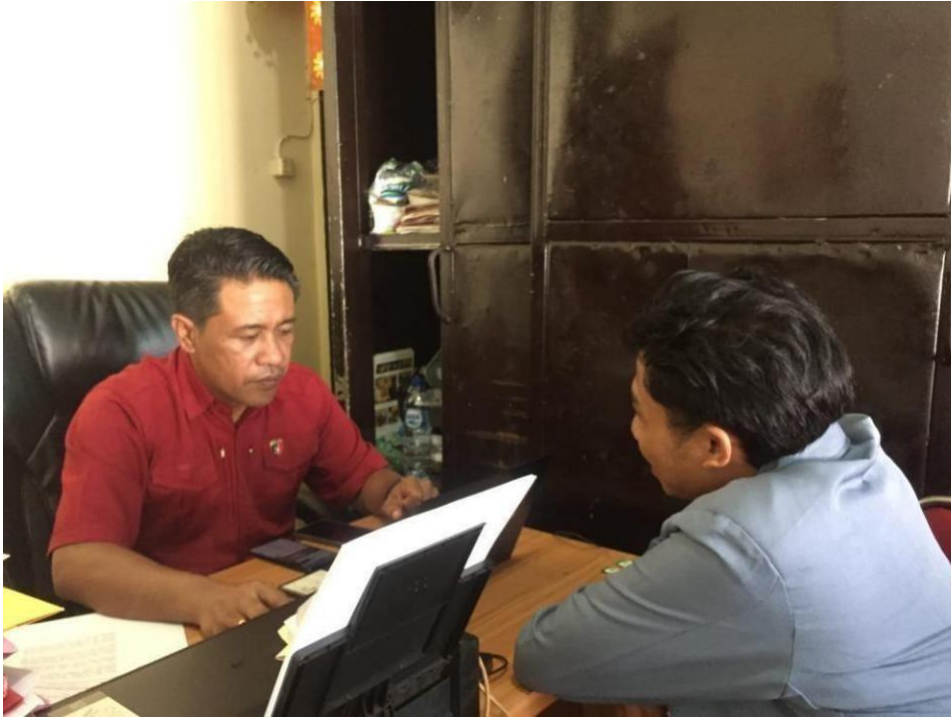
Foto Wawancara Bersama penyidik unit Tipiter